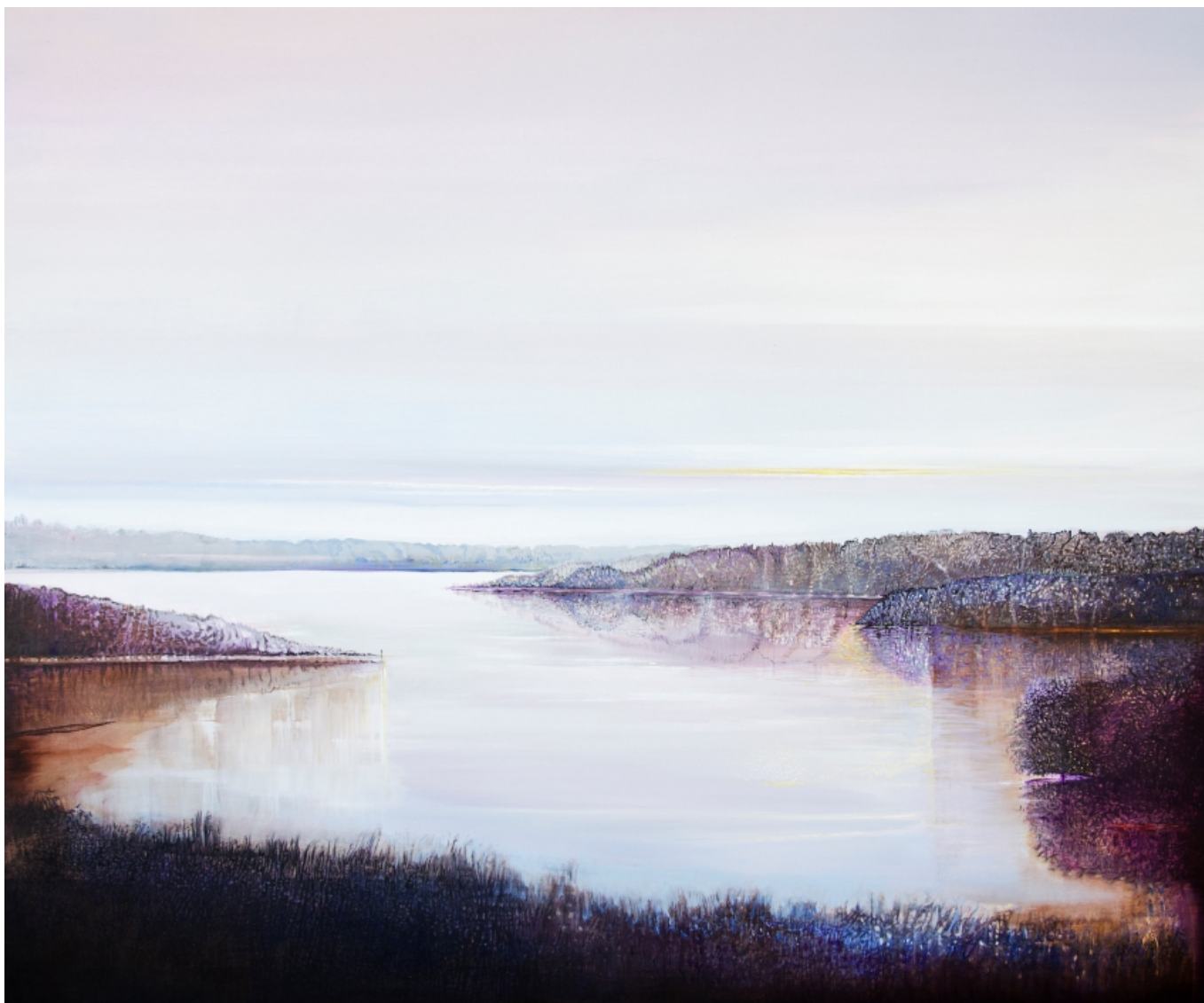
Zatoka W. 100 x 120 cm, 2022