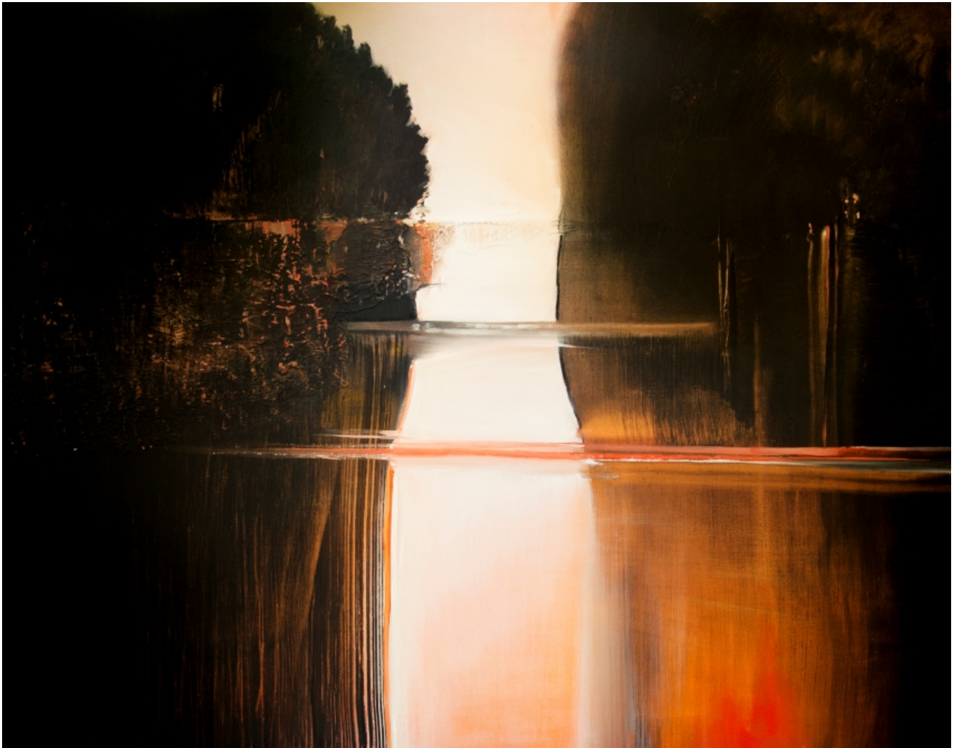
Jezioro i las 80 x 100 cm, 2022