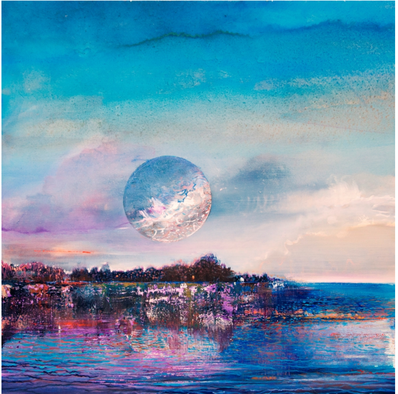
Full Moon 60 x 60 cm, 2022