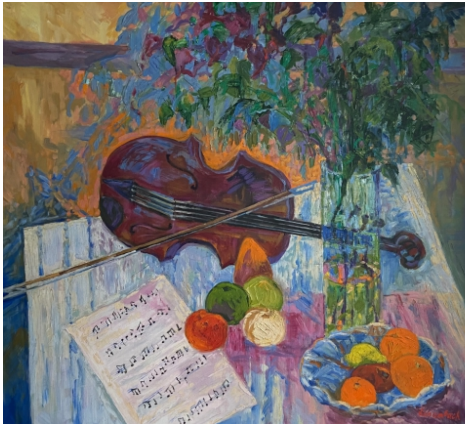
Kwiaty i skrzypce