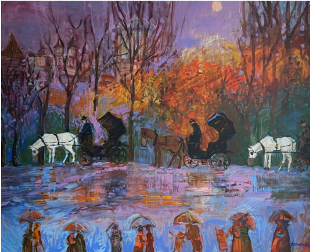
Dorożki w deszczu (jesień)