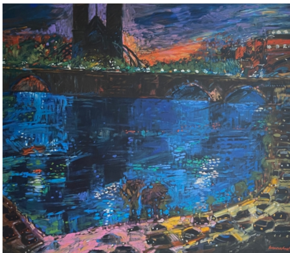
Pejzaż nocny z Paryża