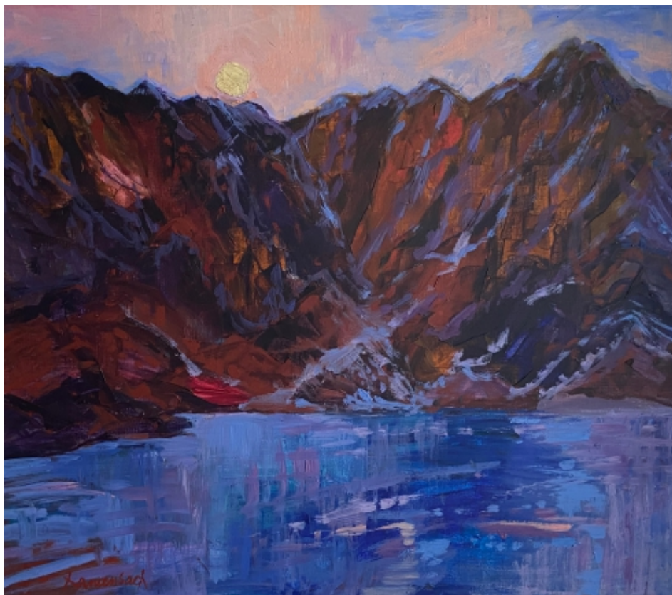
Z cyklu Morskie Oko: Świt