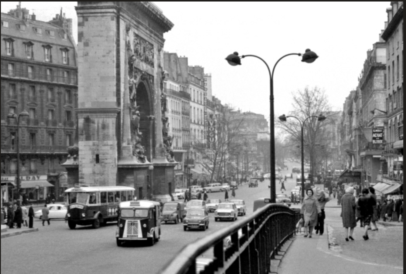
Rue St. Denis