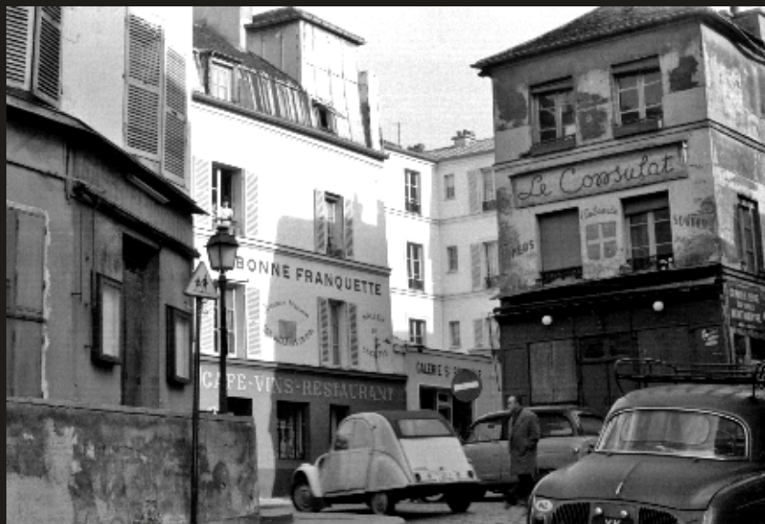
Montmartre - Rue Norvins