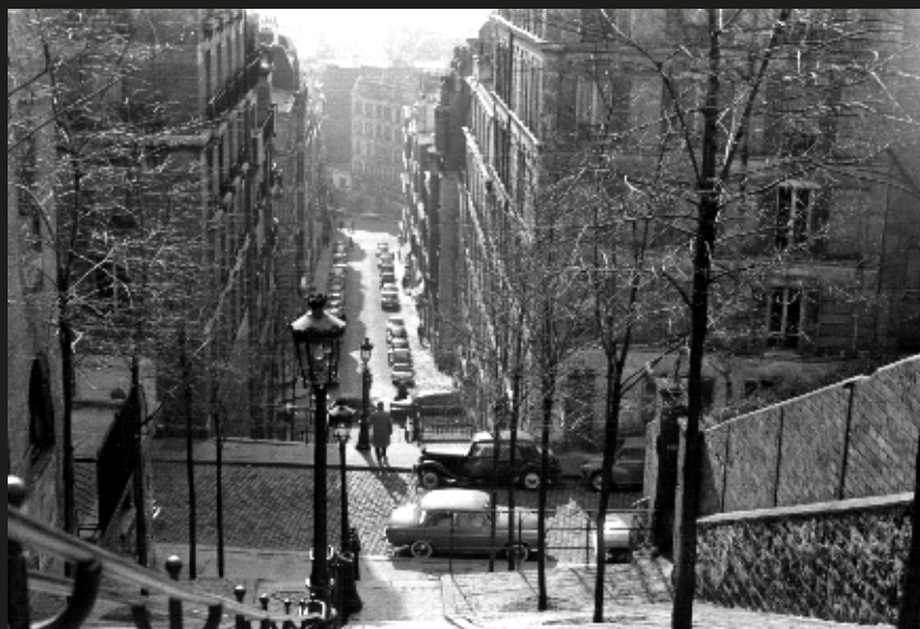
Montmartre - Rue Foyatier