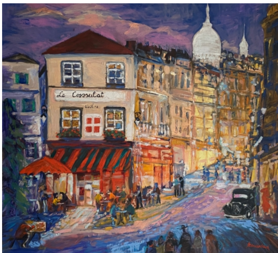
Z cyklu Montmartre: Rue Norvins