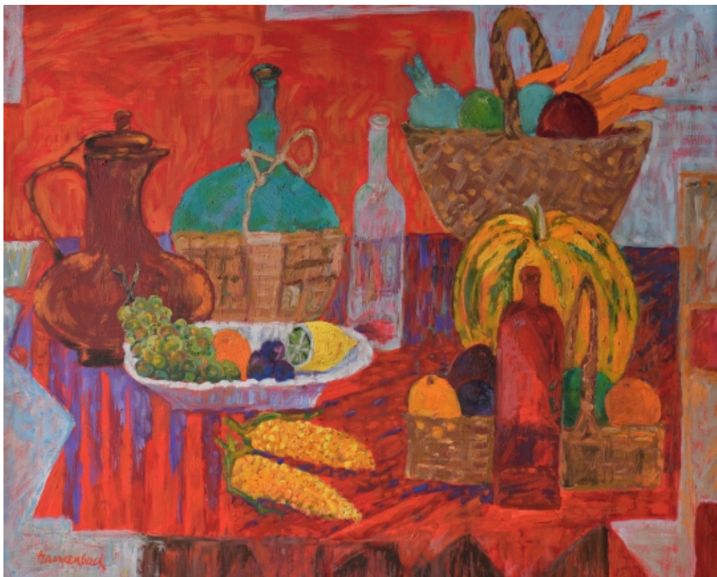
Martwa natura z miedzianym dzbankiem