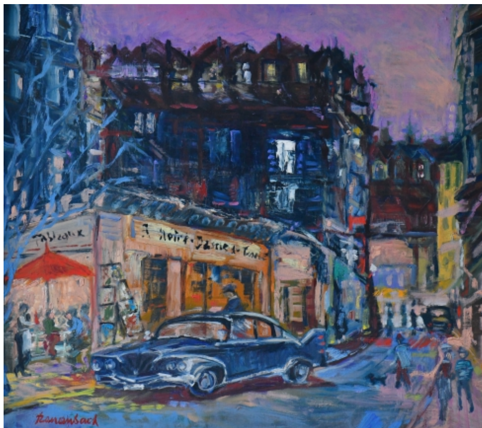
Z cyklu Montmartre Rue de Chevalier de la Barre