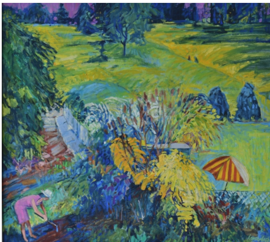
Ogród w Lanckoronie