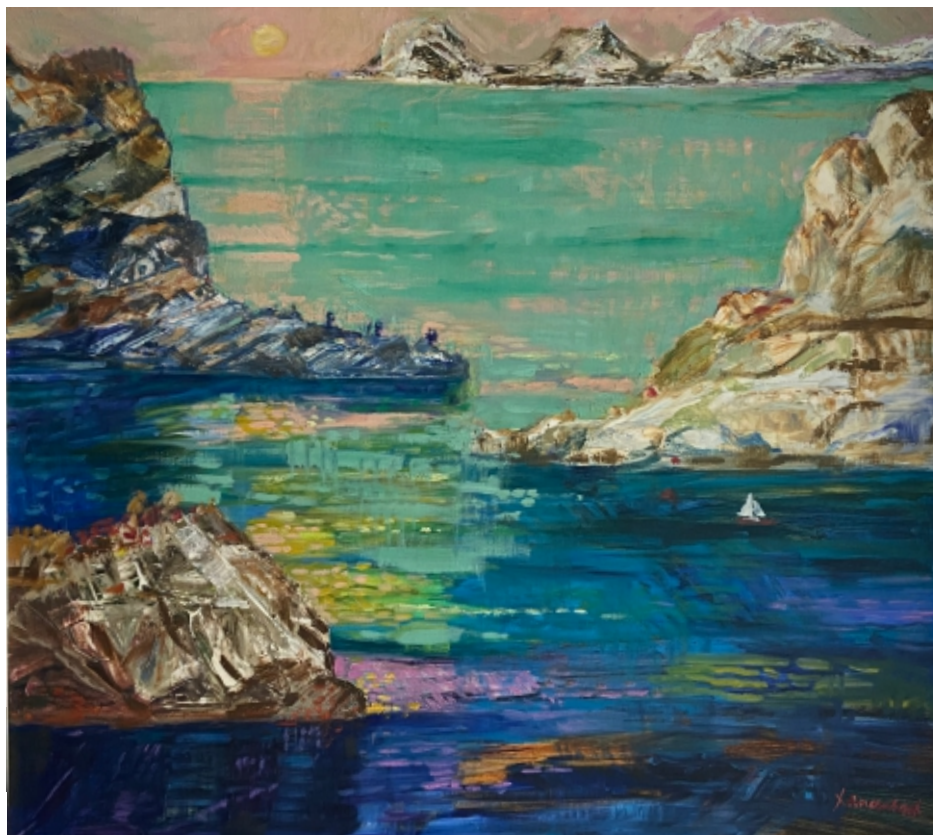
Pejzaż norweski z łódką