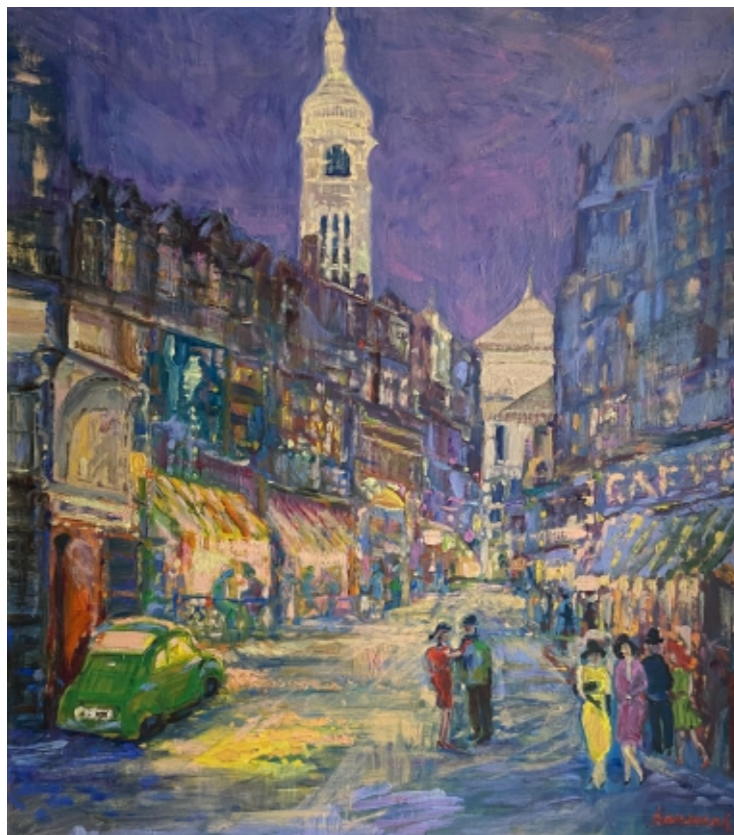
Z cyklu Montmartre: Rue du Chevalier de la Barre o zmroku