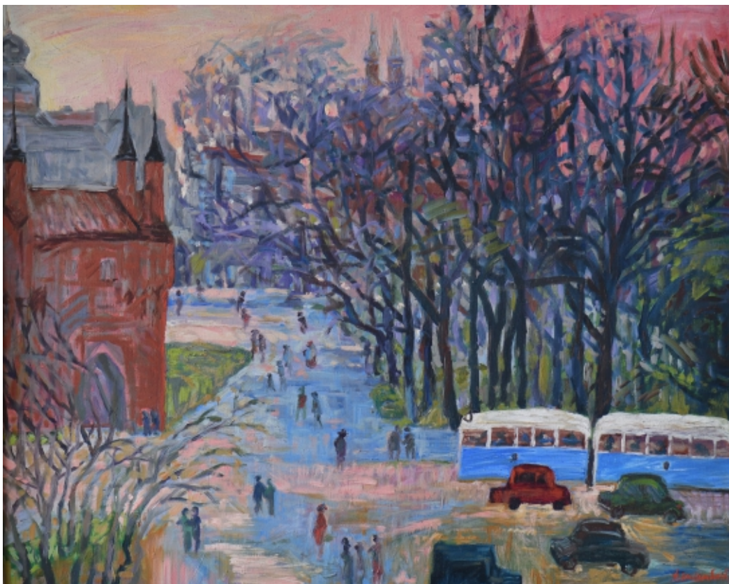
Planty w Krakowie