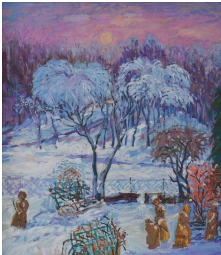
Pejzaż zimowy z chochołami