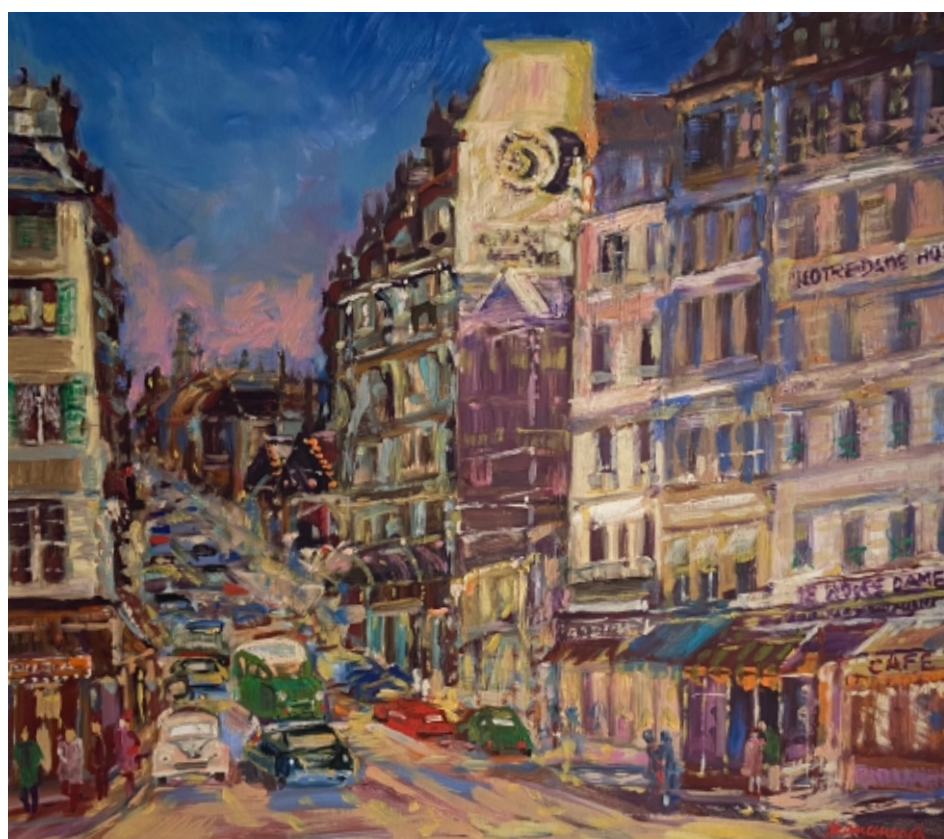
Rue Du Petit Pont