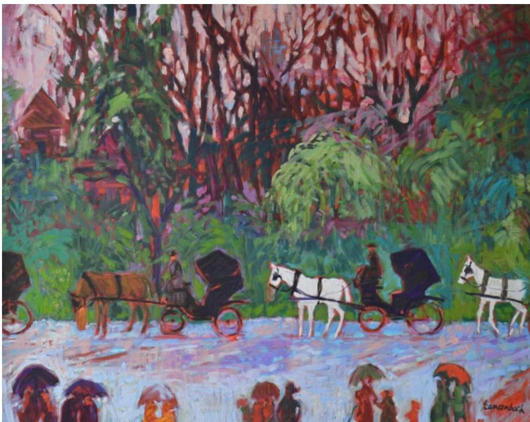
Dorożki na Plantach jesienią