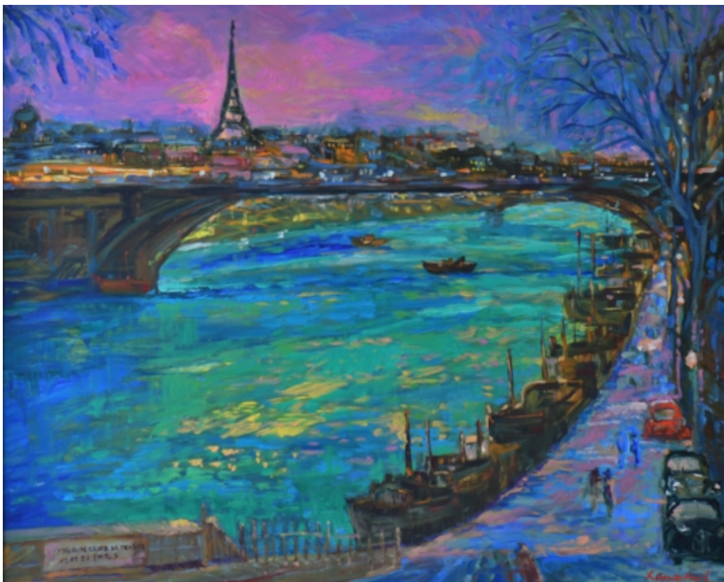
Port des Champs Elysees o zmierzchu