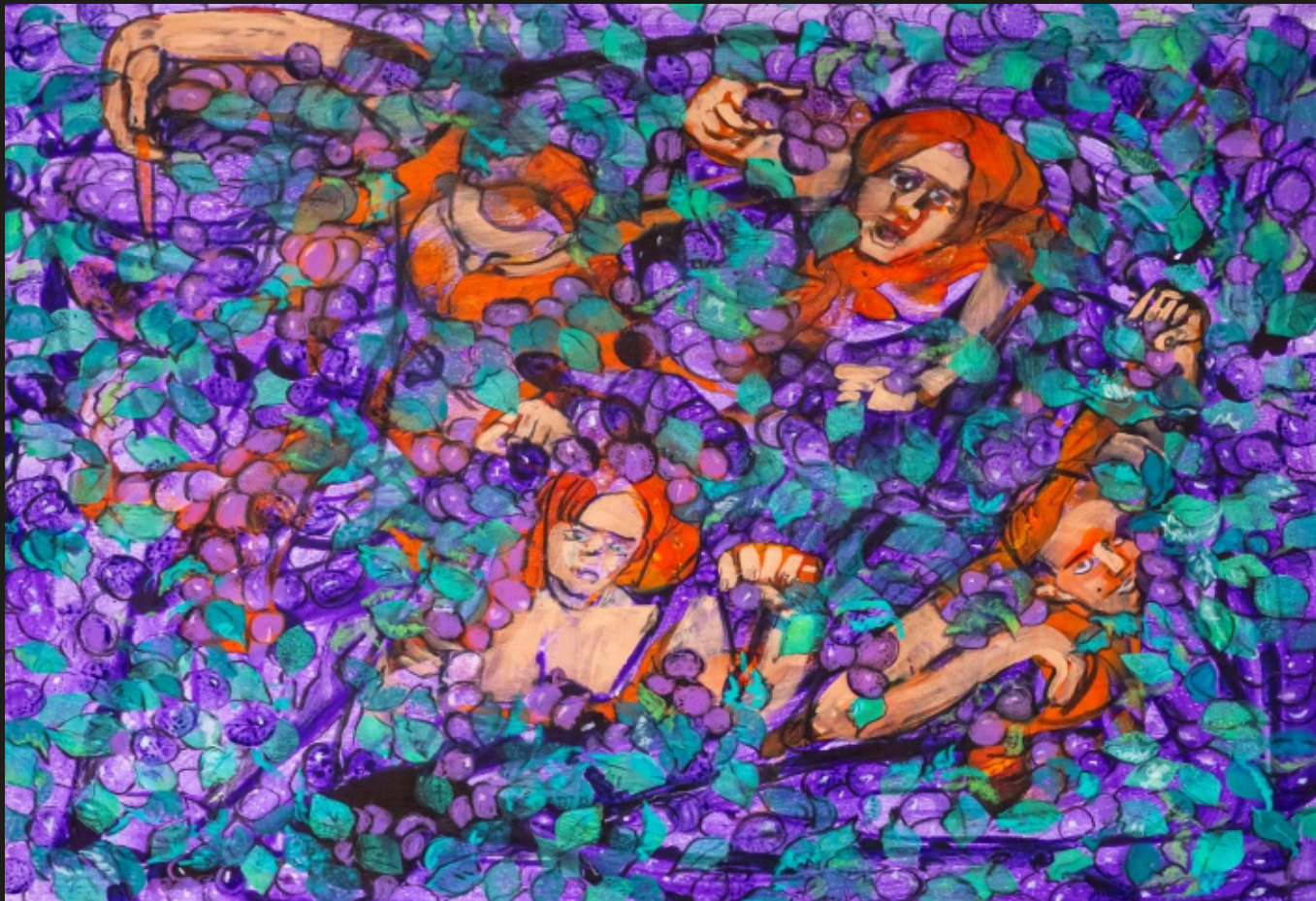
Śliwka w kompot akryl na płótnie, 80 x 100 cm, 2024