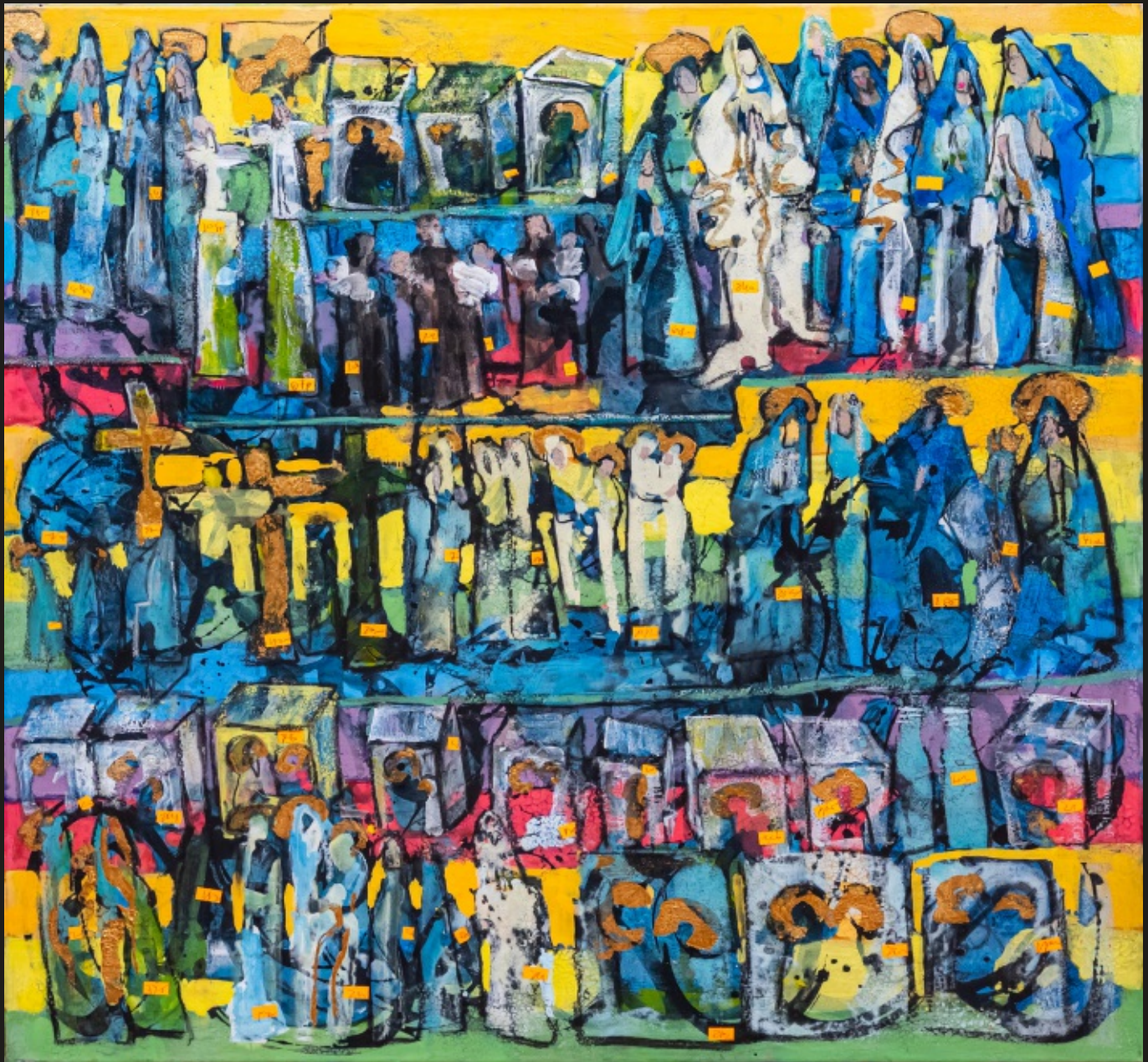
Sklep z Maryjkami akryl na płótnie, 100 x 100 cm, 2024