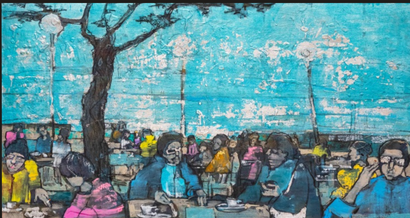
Ogródek letni akryl na płótnie, 70 x 120 cm, 2024