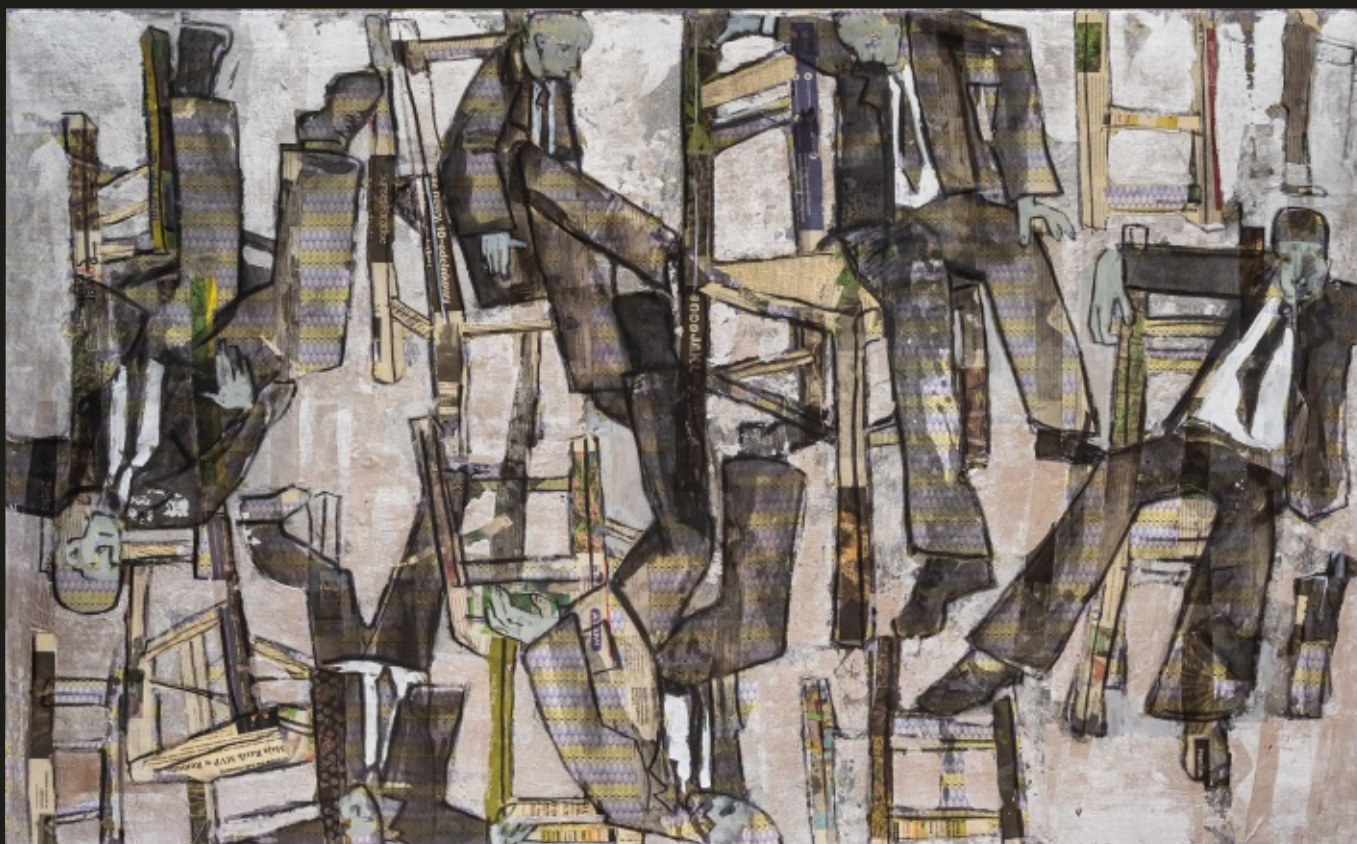
Gra w krzesła akryl na płótnie, 100 x 160 cm, 2024