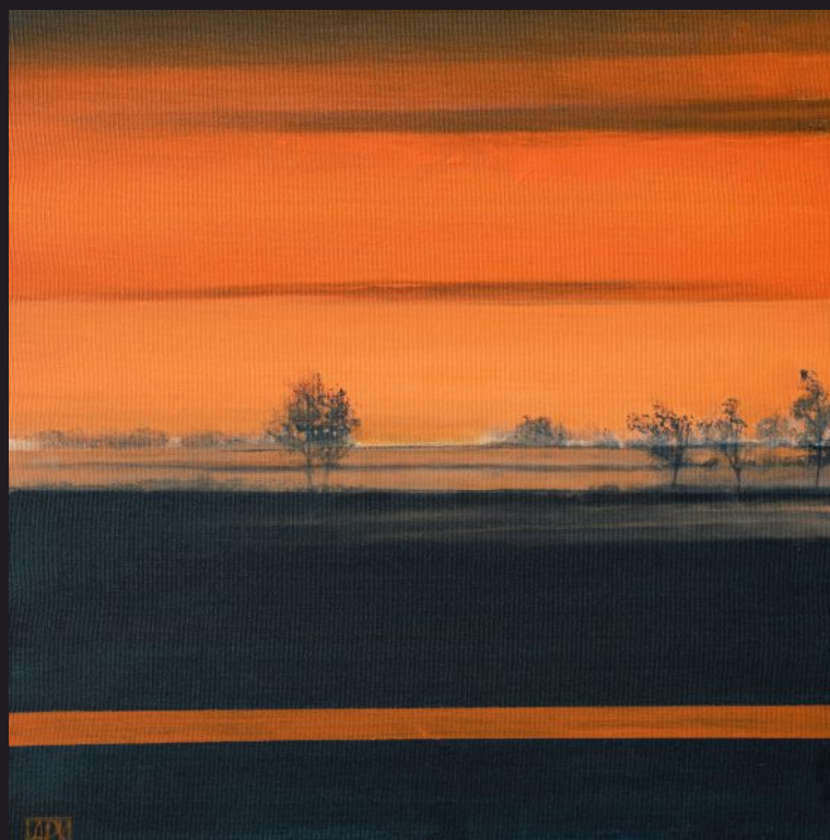
AFIRMACJA LATA akryl, płótno, 50 x 50 cm, 2024