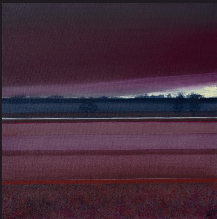
WITAJ SMUTKU akryl, płótno, 50 x 50 cm, 2025