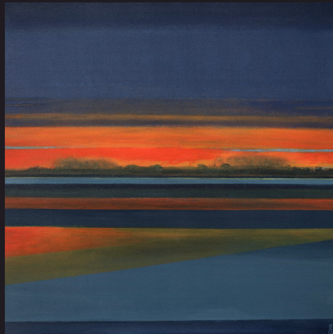
GEOMETRIA ZMIERZCHU akryl, płótno, 70 x 70 cm, 2025