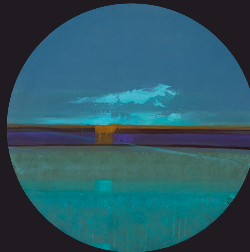
UKOJENIE akryl, płótno, 60 x 60 cm, 2025