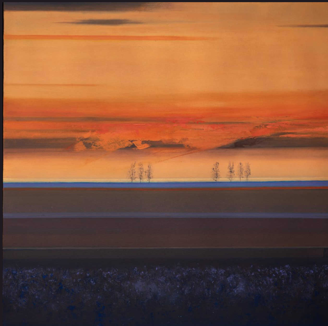
KRUCHOŚĆ akryl, płótno, 90 x 90 cm, 2025