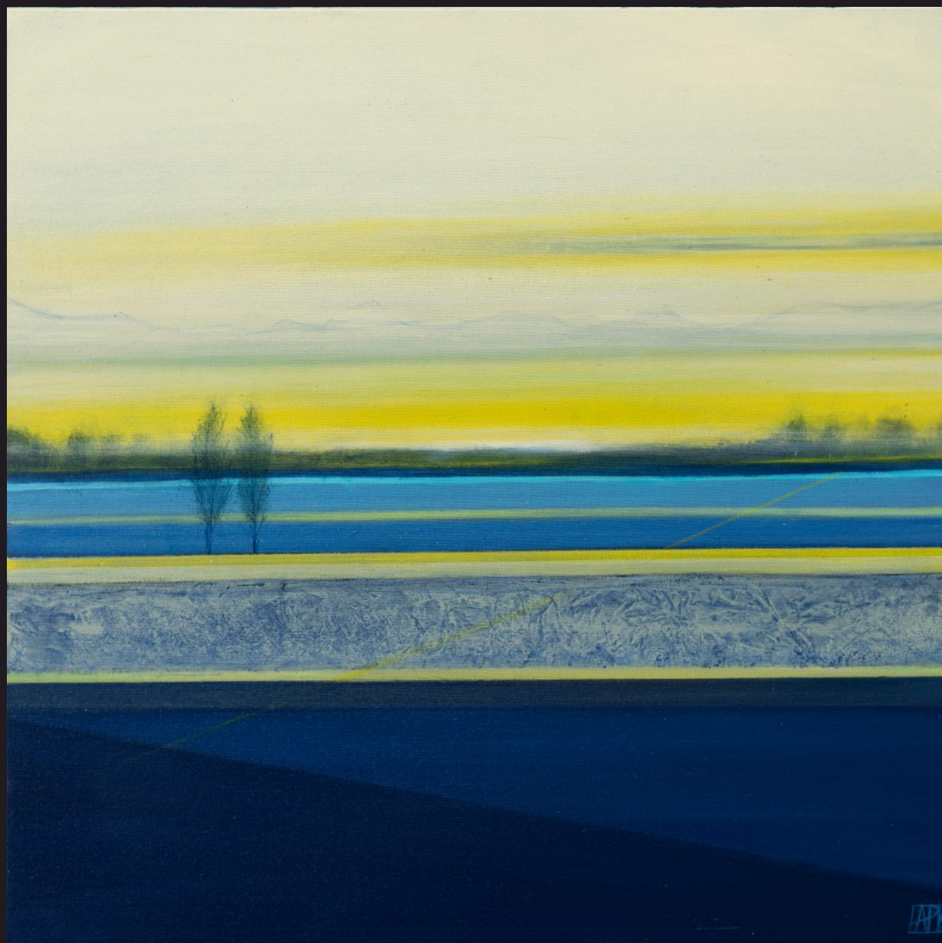
GEOMETRIA ŚWITU akryl, płótno, 70 x 70 cm, 2025