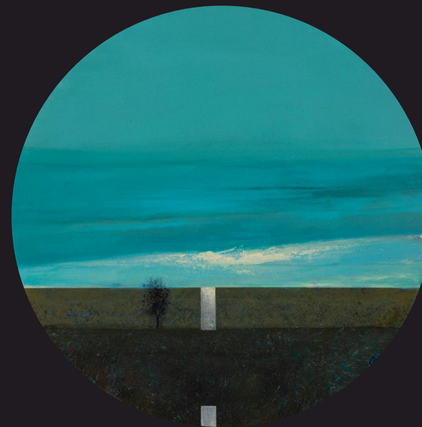
BEZMIAR akryl, płótno, 60 x 60 cm, 2025