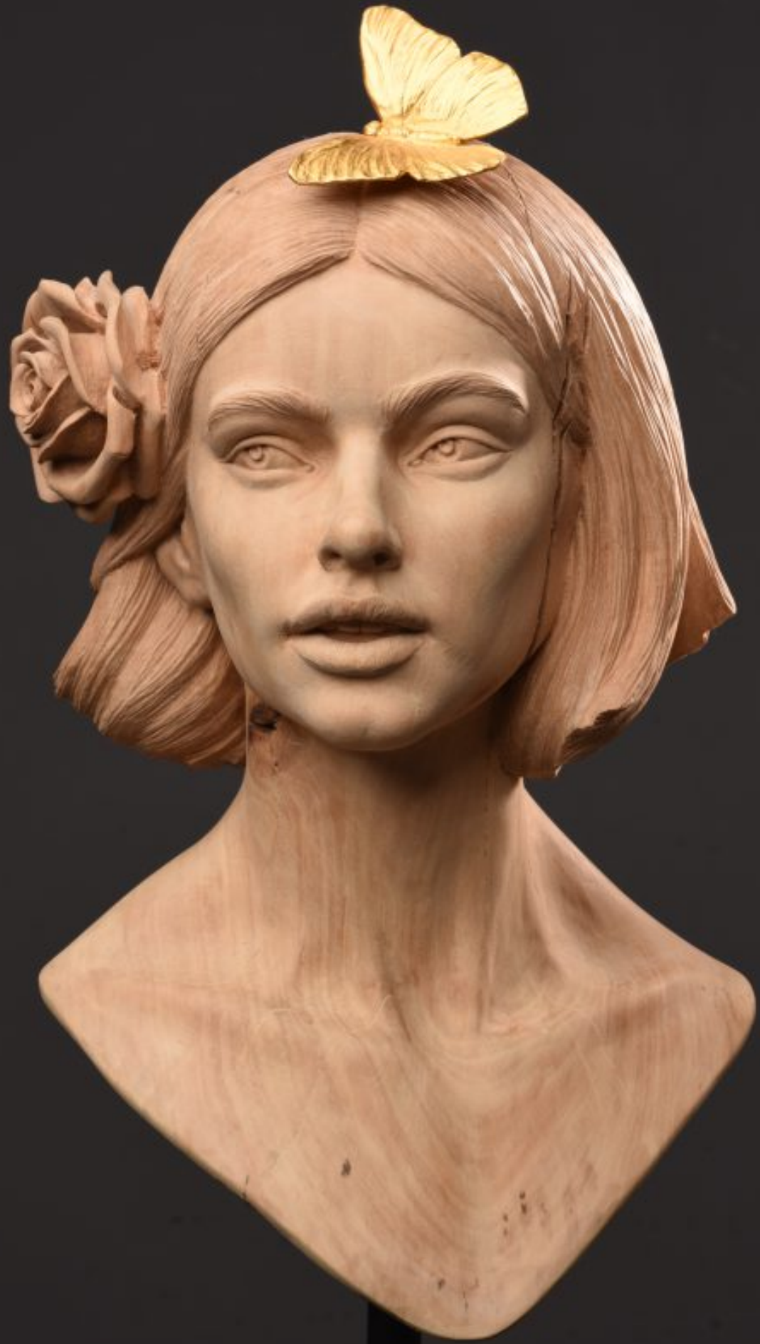
ROZKWIT 55 cm x 26 cm