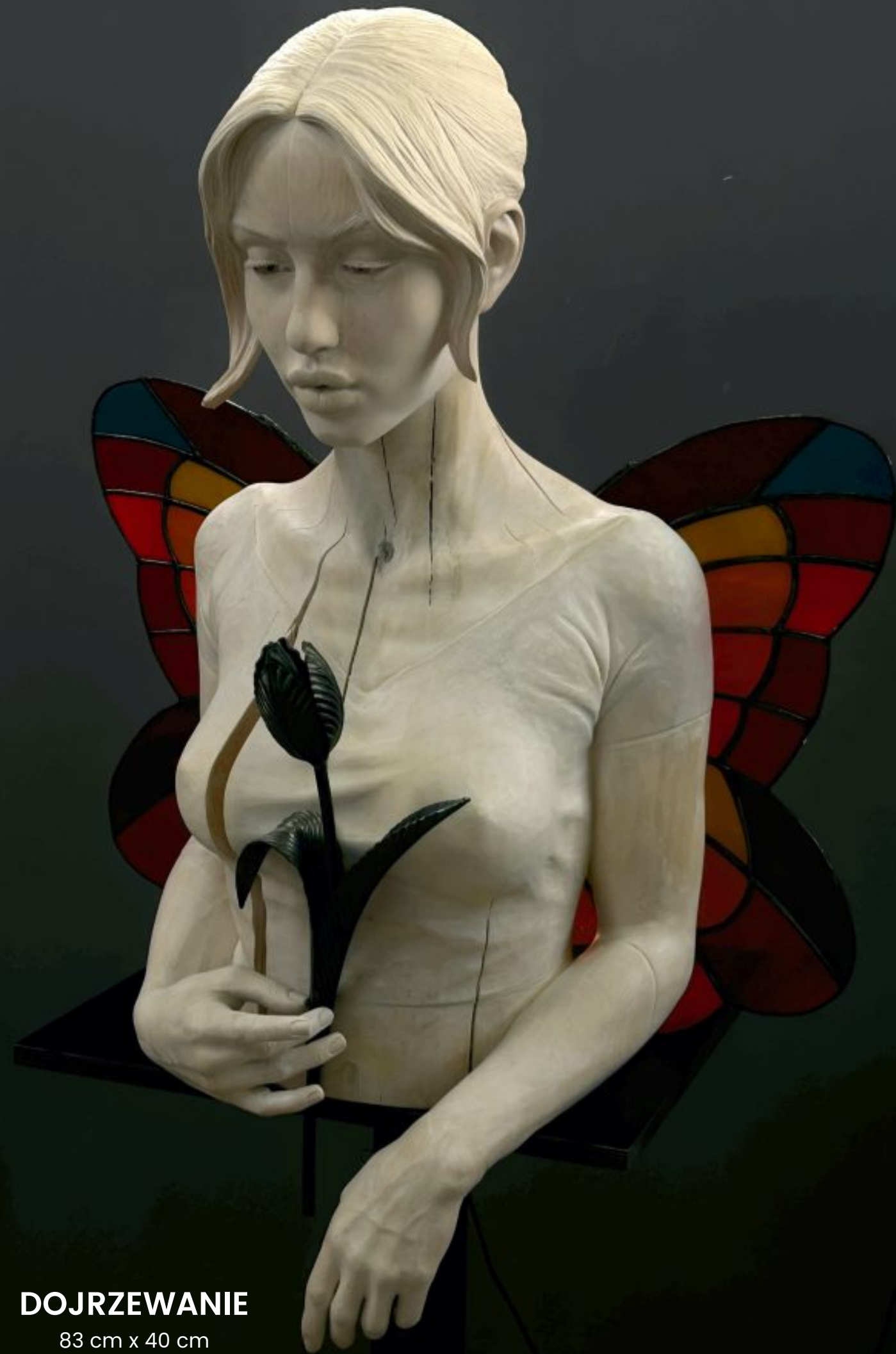
DOJRZEWANIE 83 cm x 40 cm