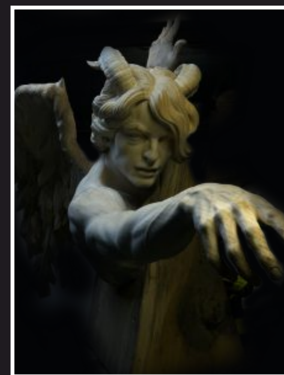
KUSICIEL 75 cm x 140 cm