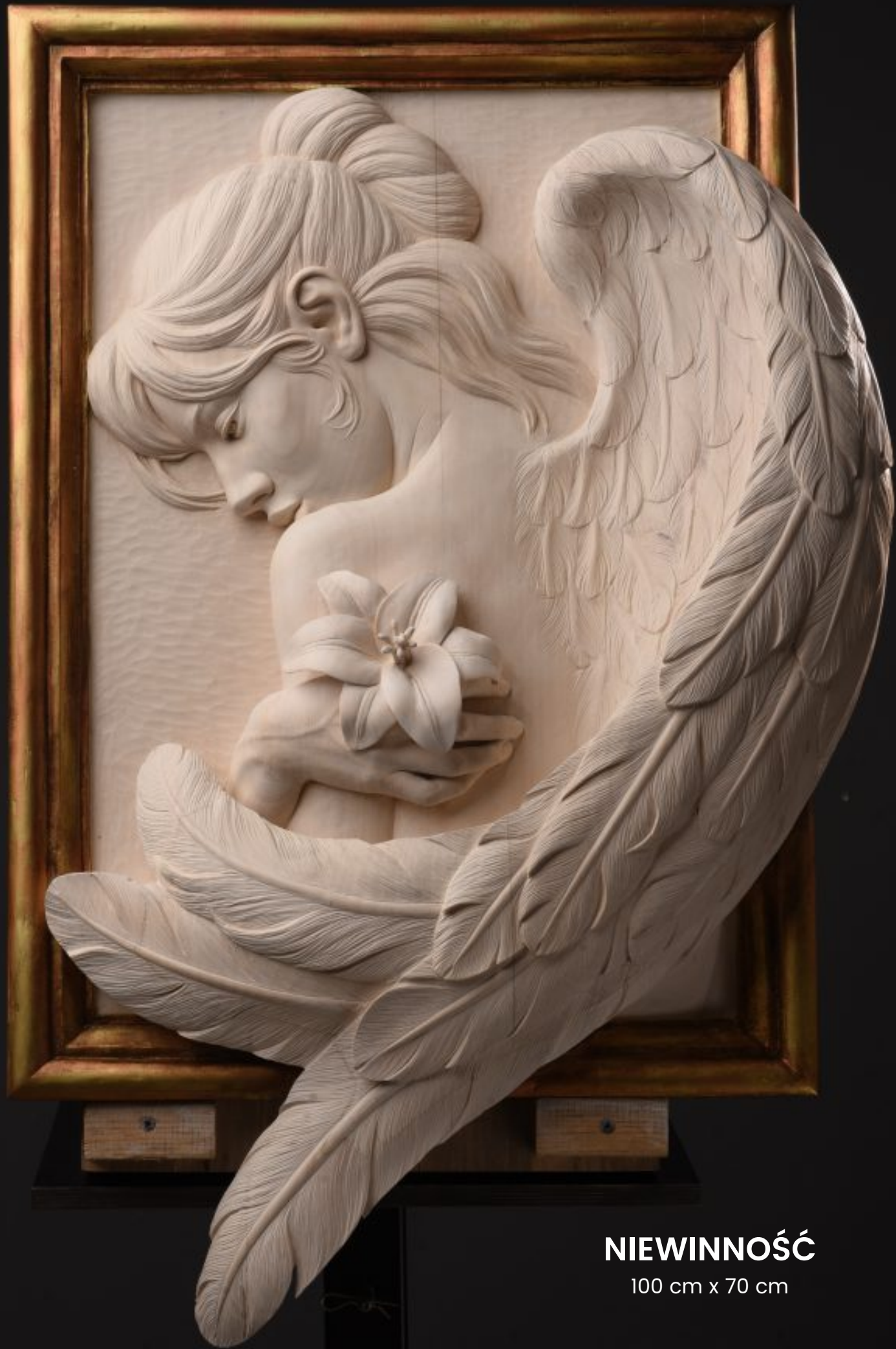
NIEWINNOŚĆ 100 cm x 70 cm