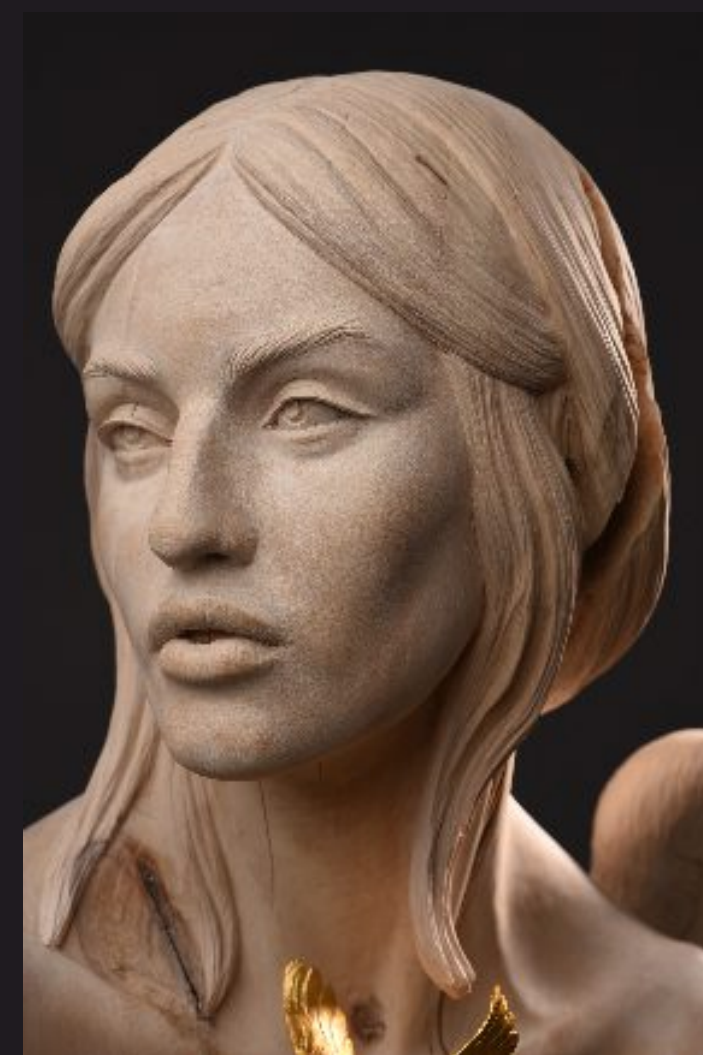
ZŁOTY PTAK 71 cm x 60 cm