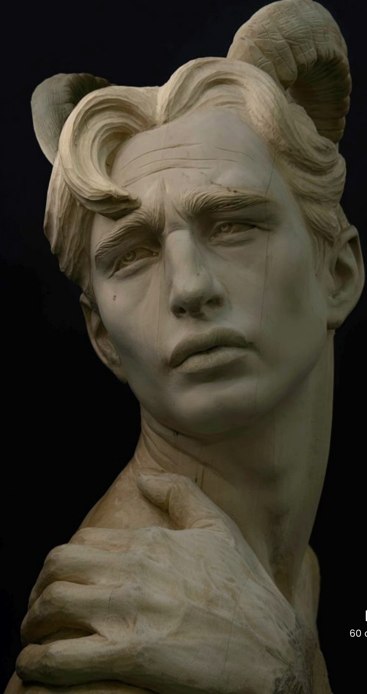
FAUN 60 cm x 45 cm