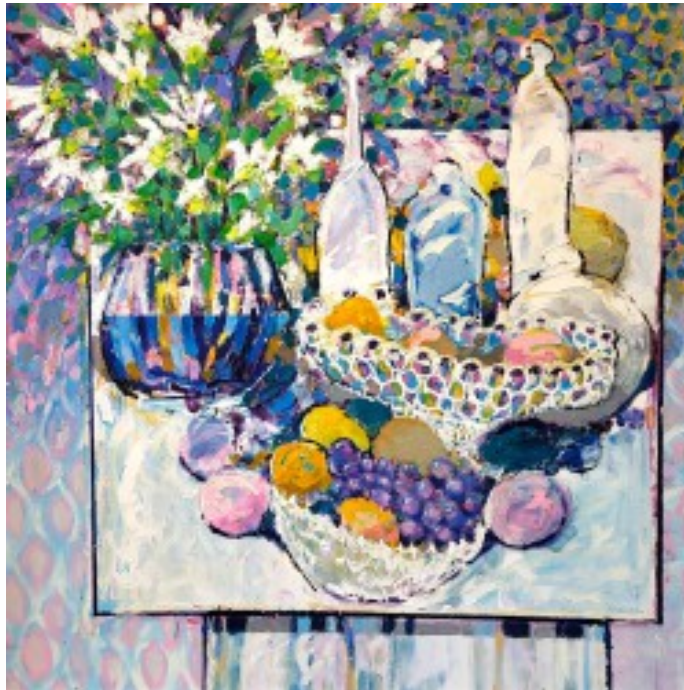
26. Martwa natura z winogronami Olej na płótnie, 80 x 80 cm

Artysta malarz, architekt. Absolwent Wydziału Malarstwa krakowskiej Akademii Sztuk Pięknych, dyplom w pracowni prof. Juliusza Joniaka oraz Wydziału Architektury Politechniki Krakowskiej. W latach 1996-1997 Stypendysta Ministerstwa Kultury i Sztuki. Otrzymał I nagrodę w IV Biennale Plastyki, Krosno; na VI Biennale Plastyki w Krośnie otrzymał wyróżnienie. Brał udział w licznych wystawach krajowych i zagranicznych, m.in. w Londynie, Wiedniu, Lipsku, Kolonii, Düsseldorfie.