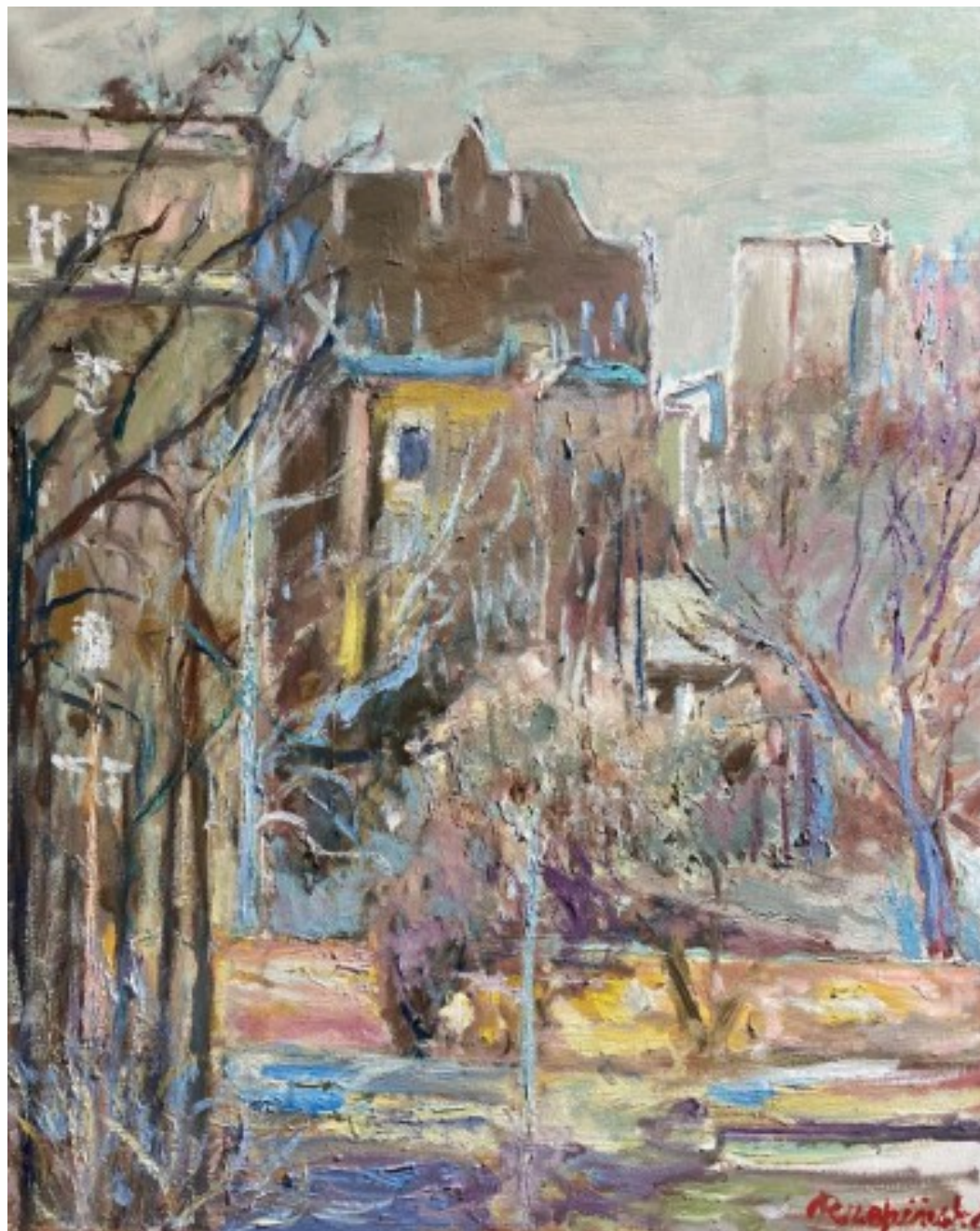
19. Pejzaż miejski olej na płótnie, 60,5 x 49,5 cm

Urodził się w 1905 r w Strusowie k. Trembowli, zmarł w 1995 r w Krakowie. W latach 1925–29 studiował w krakowskiej Akademii Sztuk Pięknych u profesorów W. Jarockiego, W. Weissa i F. S. Kowarskiego. W 1929 r. wyjechał do Paryża, by kontynuować naukę w filii krakowskiej ASP pod kierunkiem prof. J. Pankiewicza. Należał do grupy Zwornik. Po wojnie otrzymał nominację profesorską macierzystej uczelni. Czterokrotny rektor Akademii. Wystawiał w Paryżu na Salonie Jesiennym. W swoim dorobku posiada kilkadziesiąt wystaw indywidualnych w kraju i za granicą. Należy do czołówki przedstawicieli polskiego koloryzmu. Uprawiał przede wszystkim malarstwo sztalugowe, zajmował się również grafiką, rysunkiem i malarstwem ściennym. Tworzył pejzaże, martwe natury i portrety.