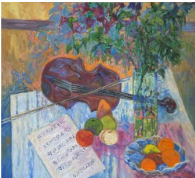
6. Kwiaty i skrzypce olej na płótnie, 85 x 95 cm, 1996 r.