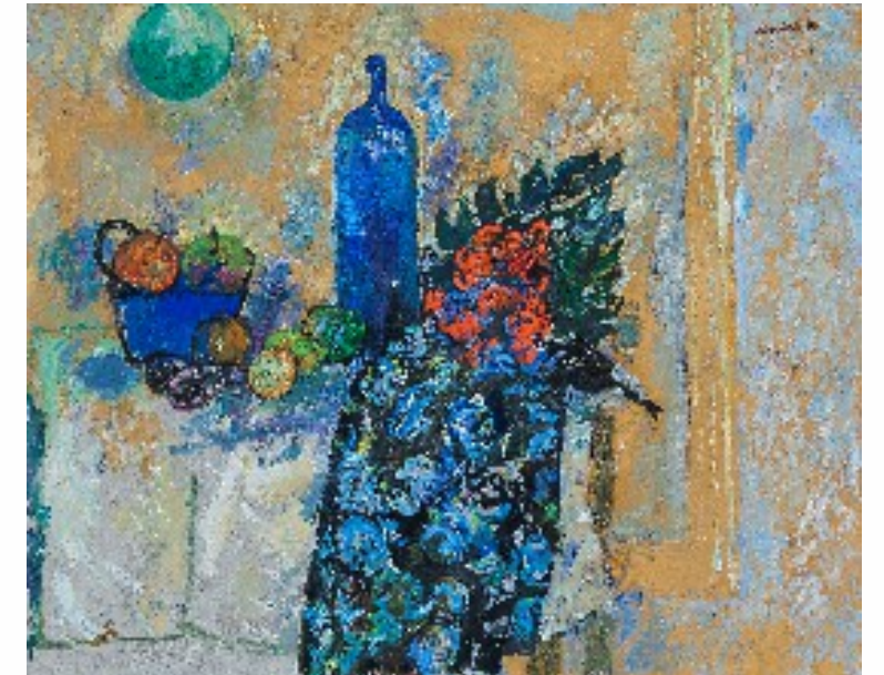
11. Martwa natura z zieloną kulą olej na płótnie, 81 x 100 cm, 1999 r.