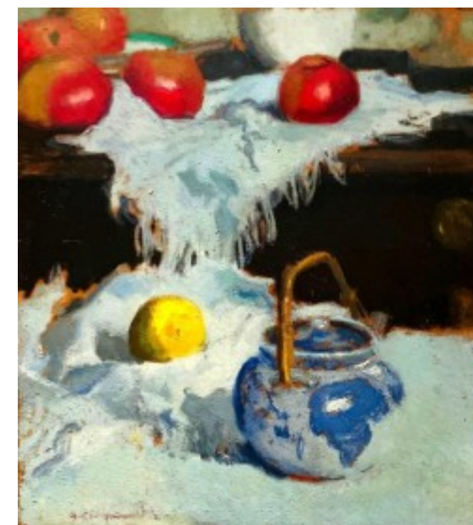
32. Alfons Karpiński – Czajnik, cytryna, jabłka olej na tekturze, 44 x 39 cm, lata 20-ste XX wieku