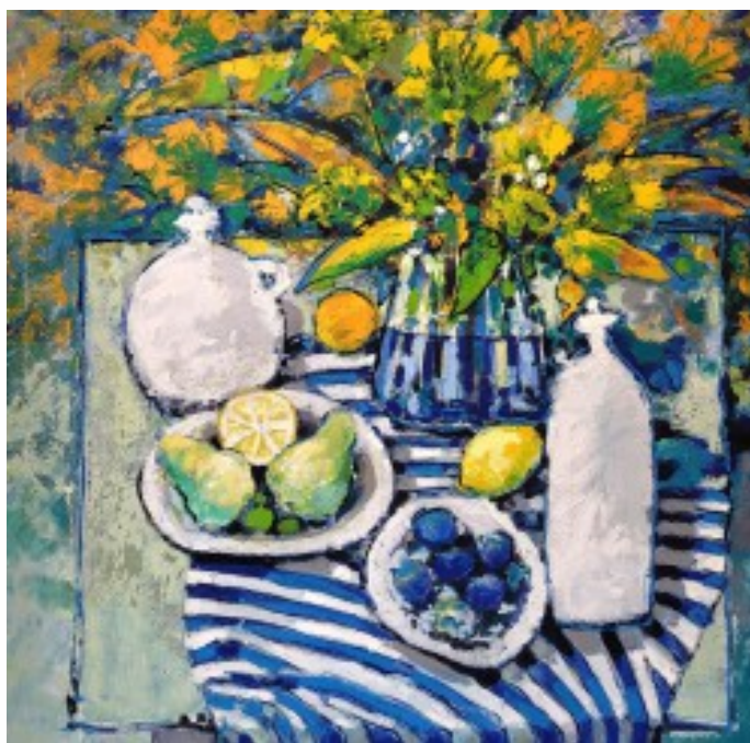
27. Martwa natura z draperią w pasy Olej na tekturze, 80 x 80 cm