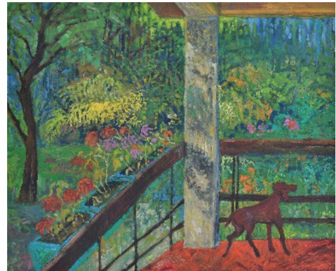
3. Balkon olej na płótnie, 85 x 95 cm, 1995 r.

*Jan Szancenbach, Zamiast wstępu , [w:] Jan Szancenbach (katalog wystawy), Galeria Piano Nobile, Kraków 1997