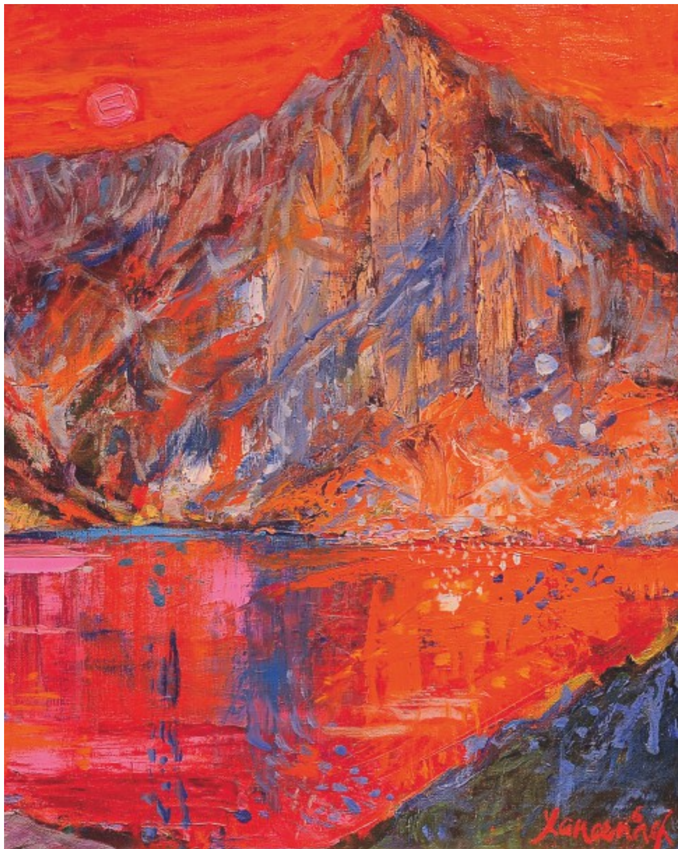
31. Jan Szancenbach – Czarny Staw – Halny (fragment) olej na płótnie, 52 x 62 cm, 1996 r.