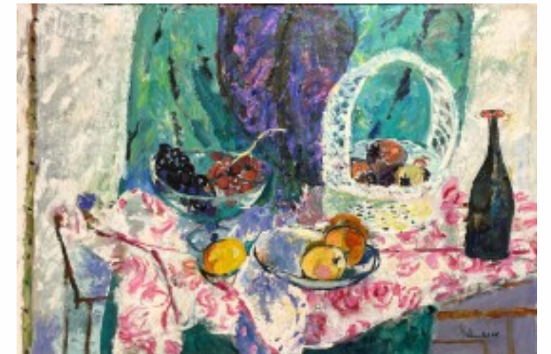
12. Biały koszyk i winogrona olej na płótnie, 65 x 95 cm, 1998 r.