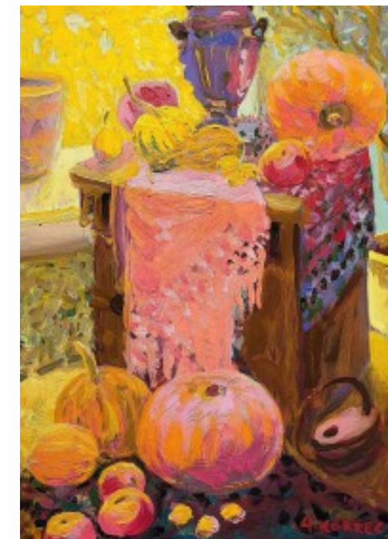
30. Dynie olej na tekturze, 53 x 38 cm, 2014 r.