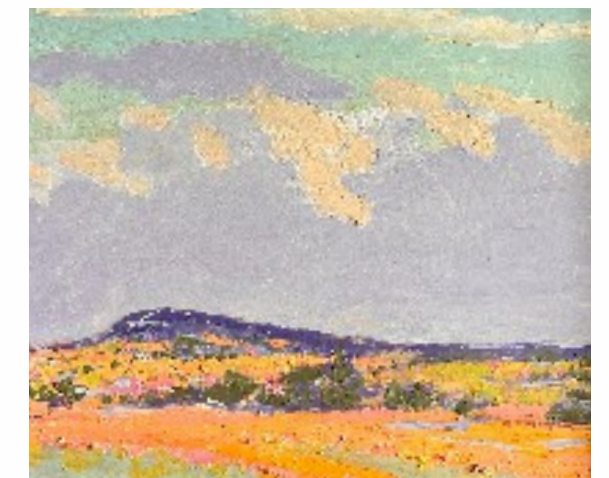
29. Fioletowy poranek olej na tekturze, 52 x 63 cm