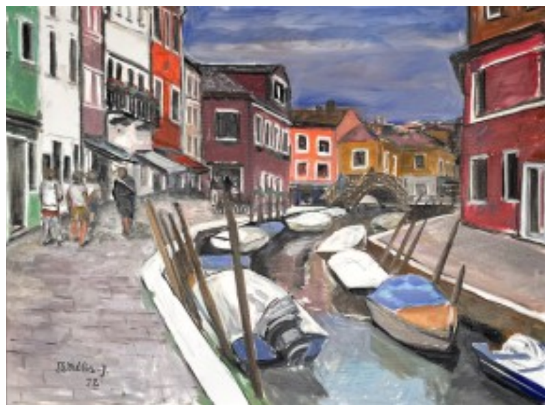
24. Burano olej na płótnie, 60 x 80 cm, 2022 r.