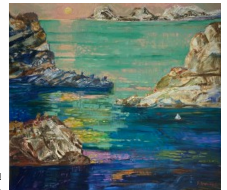
10. Pejzaż norweski z łódką olej na płótnie, 85 x 95 cm, 1997 r.