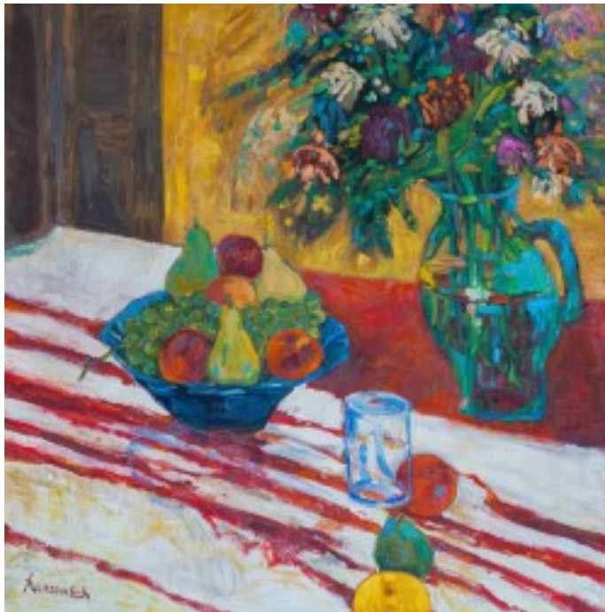
5. Martwa natura z kwiatami i brzoskwiniami olej na płótnie, 80 x 80 cm, 1996 r.