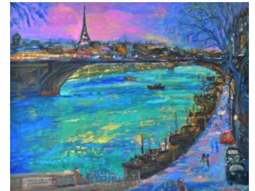
9. Port des Champs Elysees o zmierzchu olej na płótnie, 80 x 100 cm, 1996 r.