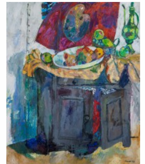
13. Martwa natura z paletą olej na płótnie, 100 x 81,2 cm, 2003 r.