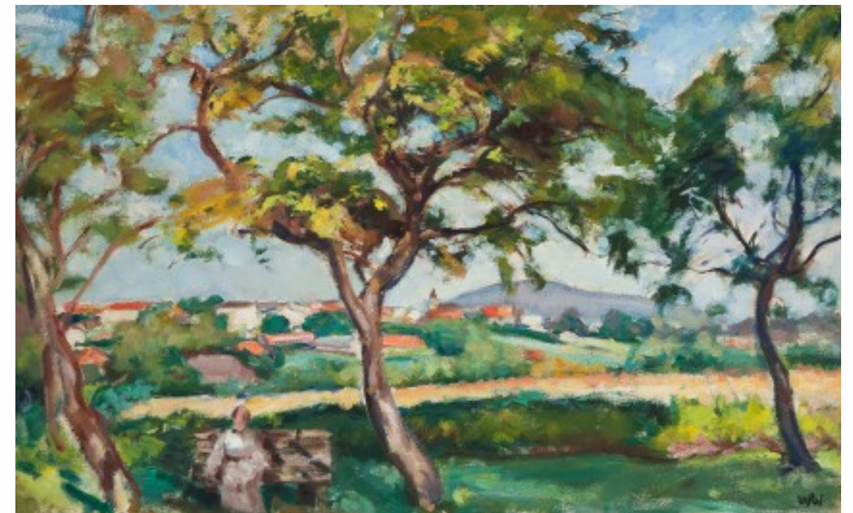
1. Wojciech Weiss – Pejzaż z ogrodu artysty w Kalwarii Zebrzydowskiej olej, płótno naklejone na tekturę, 45 x 64 cm, ok. 1920 r.