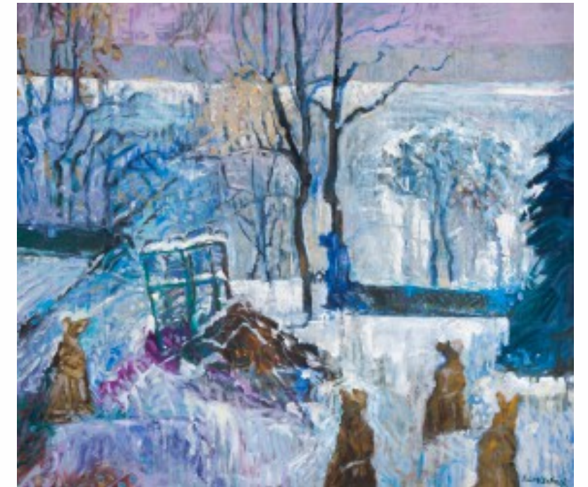
8. Pejzaż zimowy z chochołami olej na płótnie, 100 x 115,5 cm, 1988 r.