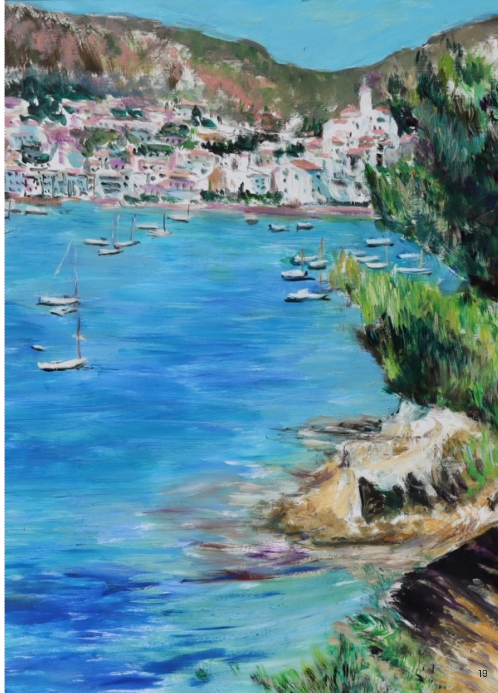
25. Łodzie w Cadaques - fragment (po prawej) olej na płótnie, 73 x 90 cm, 2021 r.