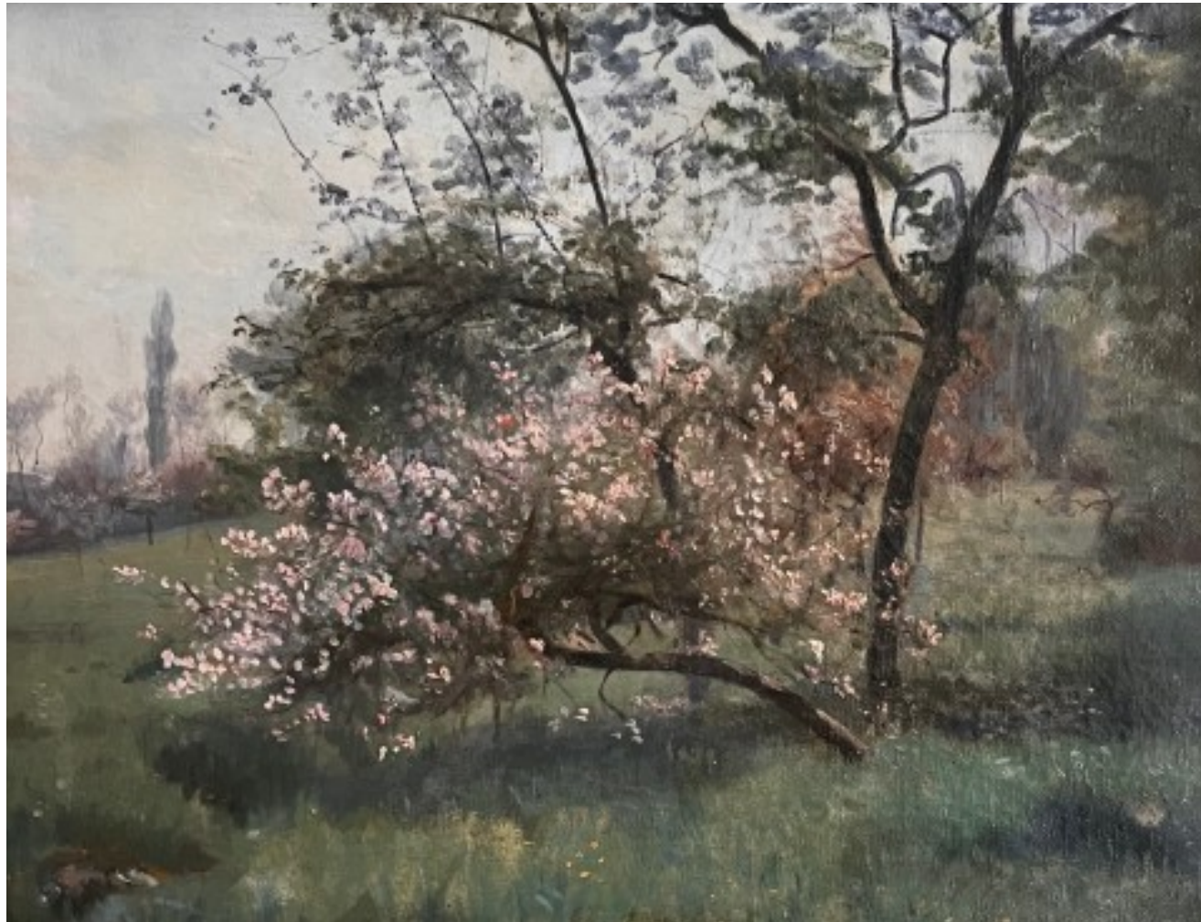
21. Kwitnąca jabłoń olej na płótnie, 29,5 x 41 cm, 1920 r.

Urodził się w 1895 r. w Ropczycach. Naukę rysunku rozpoczął w C. K. Gimnazjum w Jaśle u Apolinarego Kotowicza. Od 1919 studiował w krakowskiej Akademii Sztuk Pięknych w pracowniach profesorów Wojciecha Weissa i Teodora Axentowicza. W 1929 r. wyjechał do Paryża i przez rok studiował w filii krakowskiej akademii u Józefa Pankiewicza. Artystycznie związał się z kapistami, należał do grupy malarzkiej „Komitet Paryski”. Do Polski powrócił w 1932 r., gdzie wystawiał swoje prace razem z kapistami. Podczas okupacji wykładał na kompletach konspiracyjnych malarstwo i sztukę. W 1945 r. został profesorem Wyższej Szkoły Sztuk Plastycznych w Poznaniu. W 1949 r. przeniósł się do Warszawy, gdzie został profesorem zwyczajnym tamtejszej Akademii Sztuk Pięknych. Zmarł w 1973 r. w Warszawie.