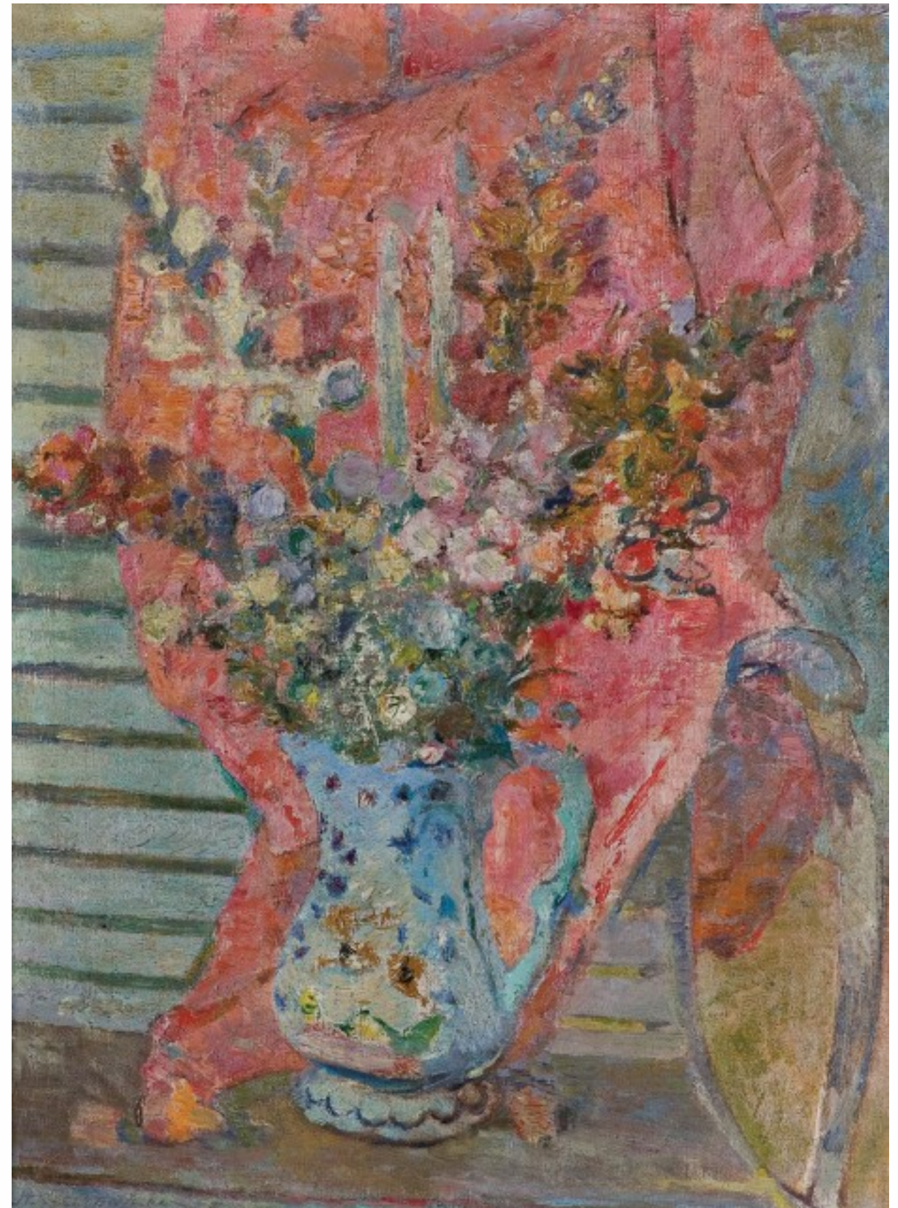
22. Martwa natura olej na płótnie, 81 x 65 cm