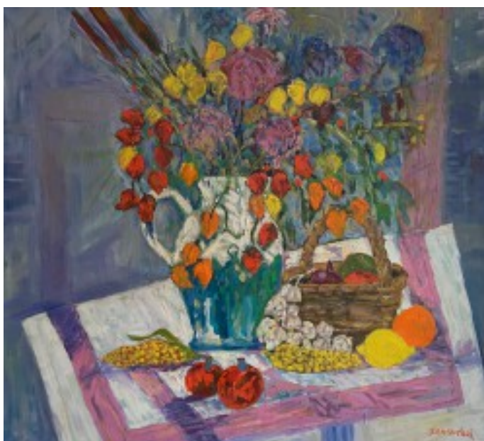
7. Kwiaty olej na płótnie, 85 x 95 cm, 1997 r.