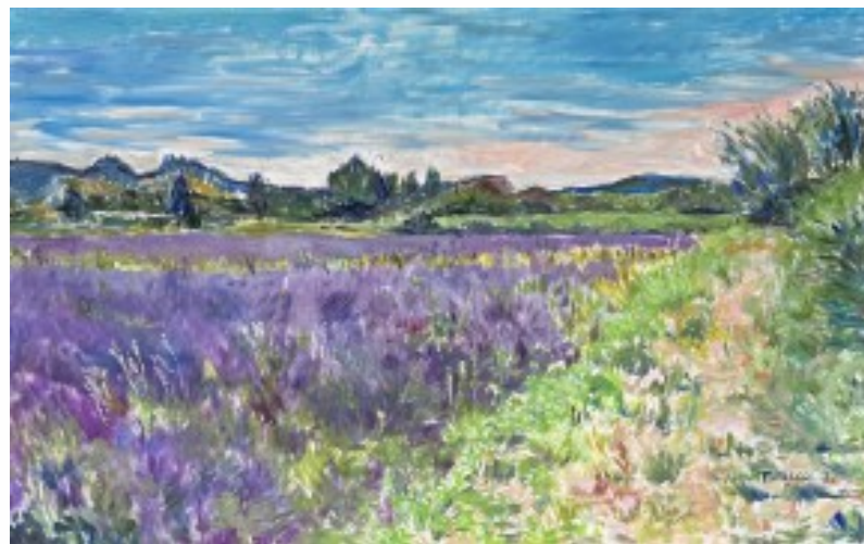
23. Pole lawendy olej na płótnie, 60 x 95 cm, 2019 r.