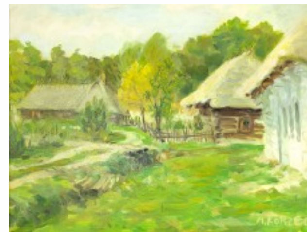
28. Pejzaż wiosenny olej na płótnie, 44 x 59 cm

Urodził się w Żarach w 1959 r. W 1989 r. uzyskał dyplom krakowskiej Akademii Sztuk Pięknych w pracowni prof. Jana Szancenbacha. Jest laureatem licznych nagród i wyróżnień. Otrzymał odznakę honorową „Zasłużony dla Kultury Polskiej”; Medal „Zasłużony Kulturze – Gloria Artis”; Nagrodę Miasta Rzeszowa w dziedzinie kultury i sztuki za osiągnięcia artystyczne w dziedzinie twórczości plastycznej. W latach 1996-1997 był stypendystą Ministra Kultury i Sztuki. W swoim dorobku artystycznym, posiada wystawy indywidualne i zbiorowe, w kraju i zagranicą. Jego prace znajdują się w prywatnych kolekcjach w Europie, Ameryce Północnej i Azji. Regularnie przekazuje swoje prace na aukcje charytatywne. Przez ponad 30 lat pracował jako nauczyciel rysunku i malarstwa w Zespole Szkół Plastycznych w Rzeszowie. Od kilku lat mieszka i tworzy we Wrocławiu.