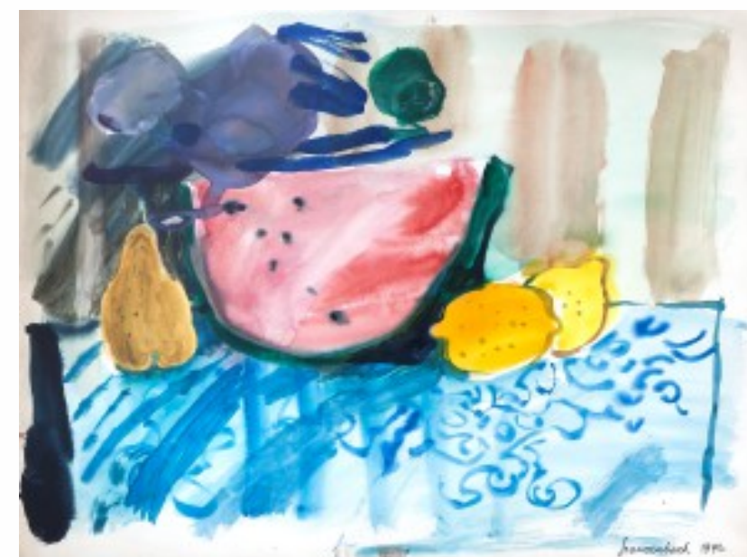
2. Jan Szancenbach – Martwa natura z arbuzem akwarela na papierze, 38 x 50 cm