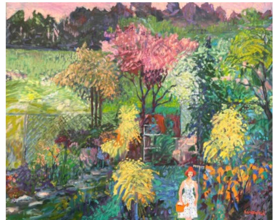
4. Ogród olej na płótnie, 90 x 110 cm