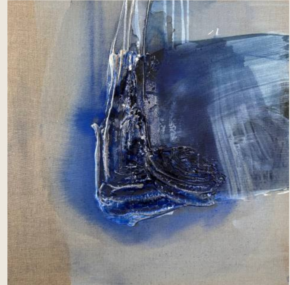
Stan ciężaru VIII, Ślad 70 x 70 cm, mix media, 2026