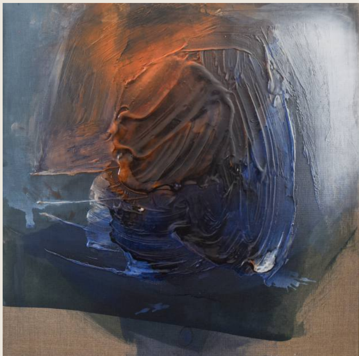
Stan ciężaru V, Warstwa 70 x 70 cm, mix media, 2026