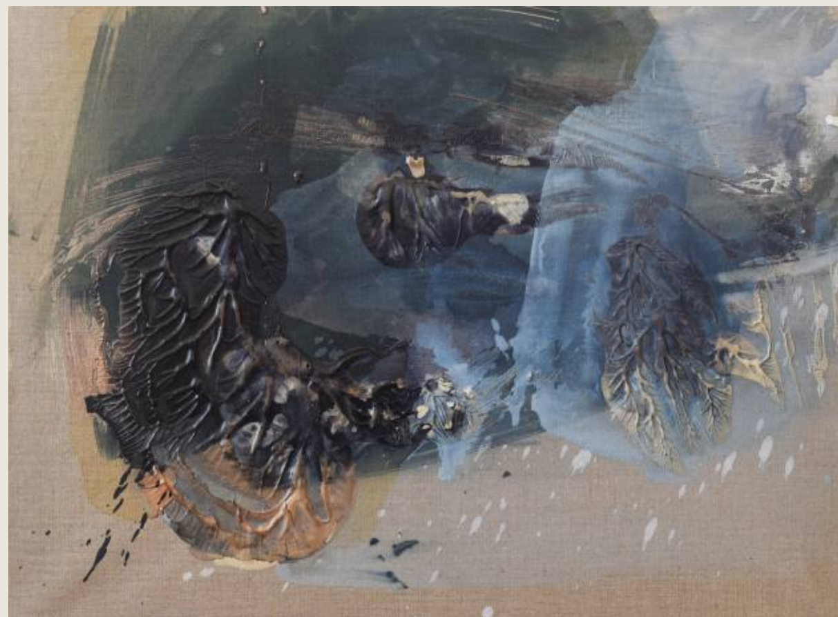
Stan ciężaru IX, Napięcie 60 x 80 cm, mix media, 2026