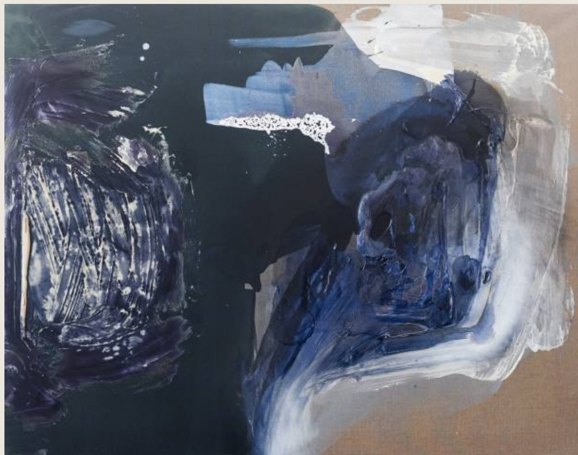
Stan ciężaru II, Kompresja 110 x 140 cm, mix media, 2026