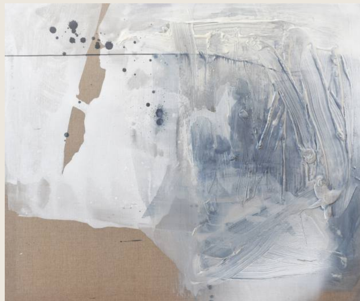
Stan ciężaru III, Ciszka 100 x 120 cm, mix media, 2026