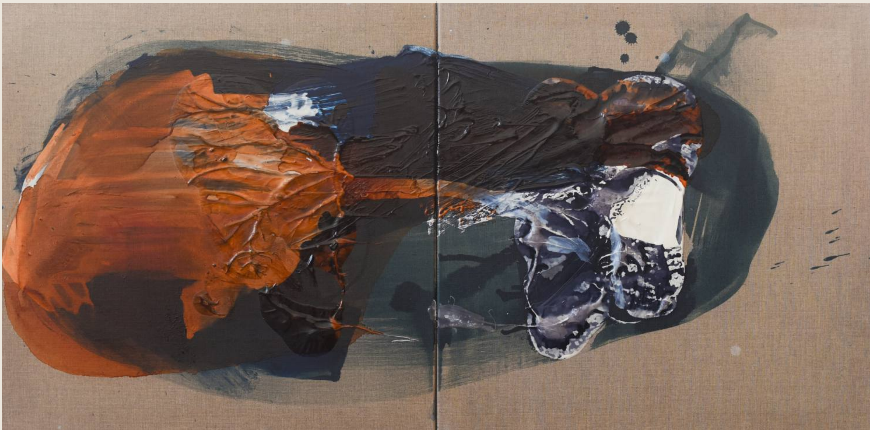
Stan ciężaru VII, Rdzeń 70 x 140 cm, mix media, 2026