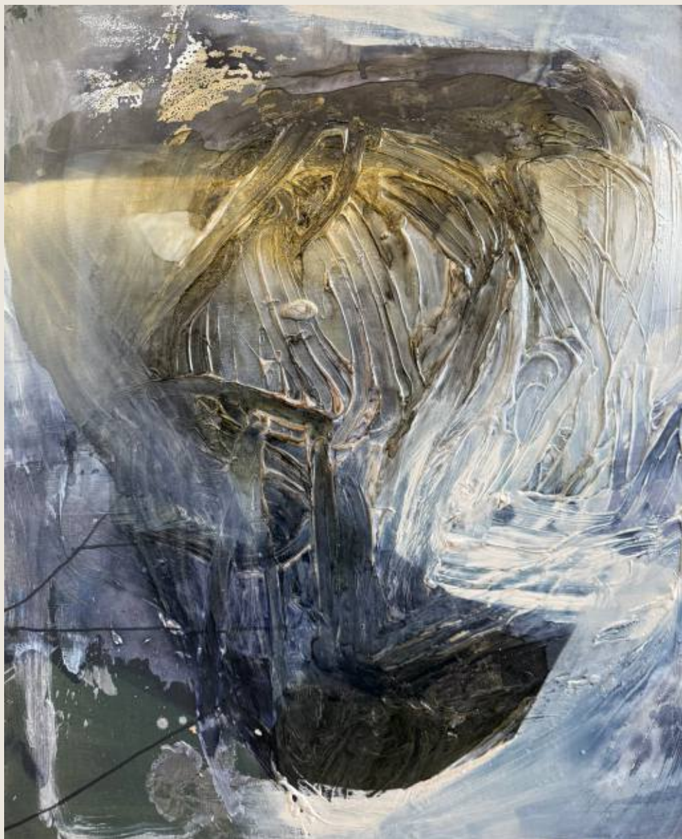
Stan ciężaru IV, Pęknięcie 120 x 100 cm, mix media, 2026