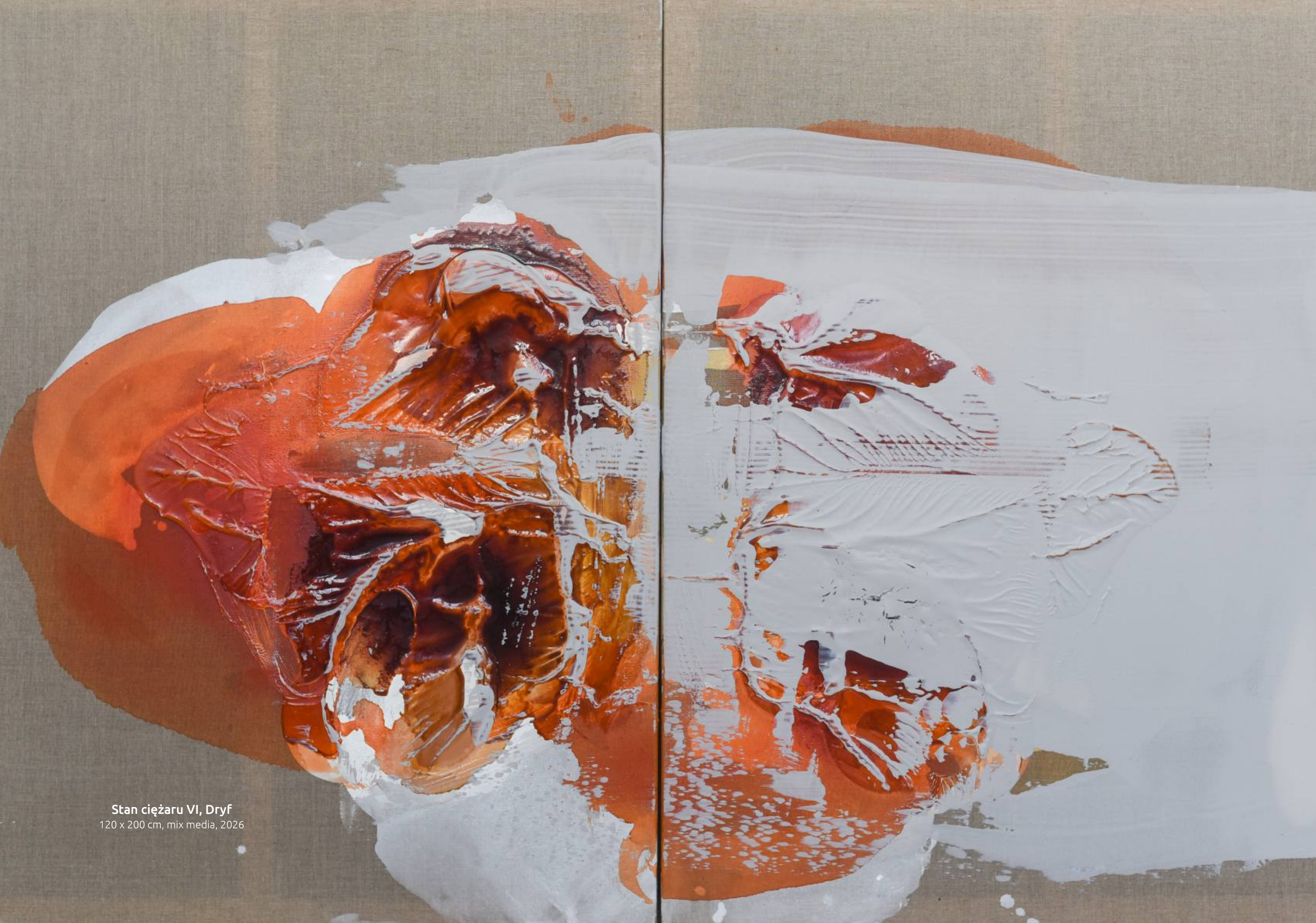
Stan ciężaru VI, Dryf 120 x 200 cm, mix media, 2026