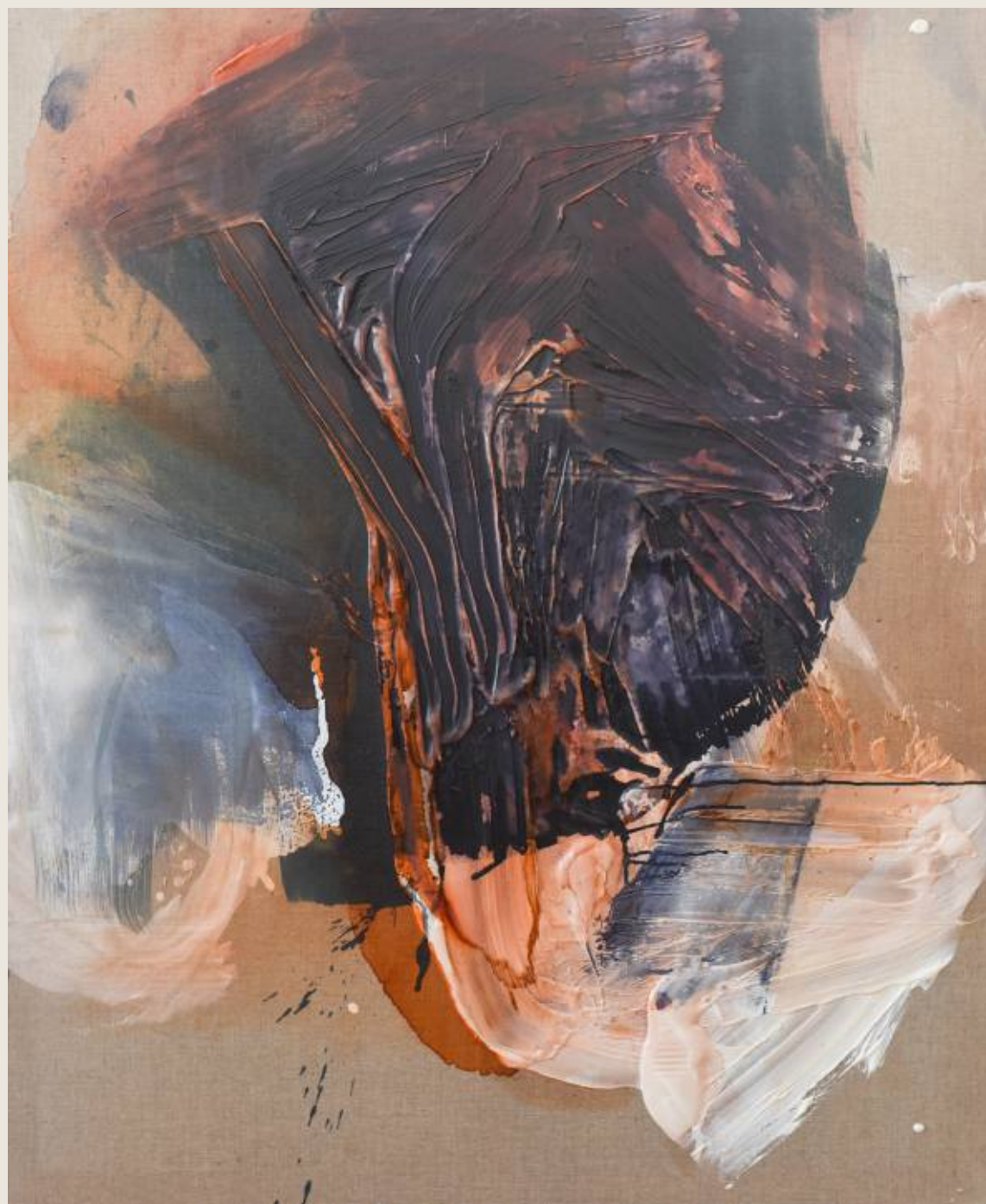
Stan ciężaru X, Zapadanie 120 x 100 cm, mix media, 2026