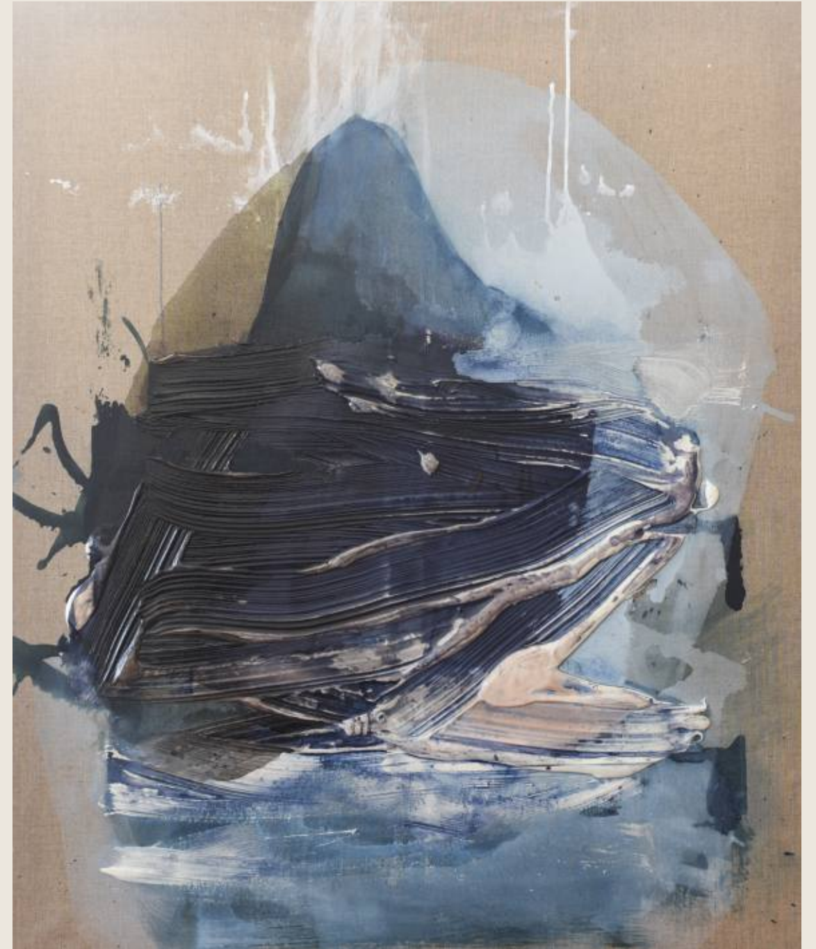
Stan ciężaru I, Opadanie 120 x 100 cm, mix media, 2026